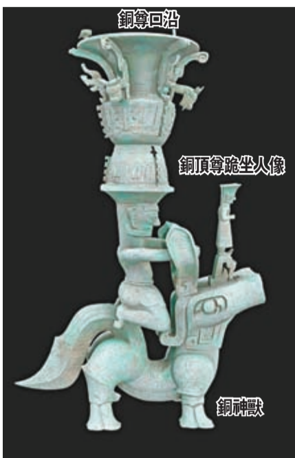
銅獸狀坐人頂尊銅像 高度：通高1.589米

特色：由身人像呈鳥獸獠牙神姿態。神像的主體架構是壘型底座和主幹軀形尊。尊飾飾獸面紋和蕉葉紋，器形與紋飾都具有中原文化風格，又彰顯古蜀文化本色。