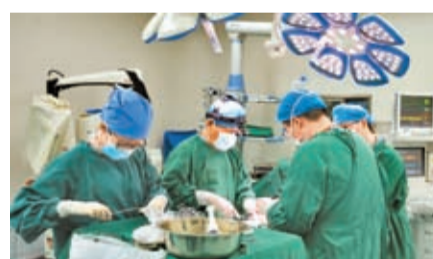
醫生將捐獻的腎臟移植給受捐者。網上圖片

香港文匯報訊 據新華社報道，11日是中國器官捐獻日。中國人體器官捐獻管理中心最新數據顯示，截至目前，中國累計器官捐獻志願登記者超過626萬人，公民逝世後器官捐獻累計完成45,800多例，捐獻器官13.9萬多個，挽救了10多萬名器官衰竭患者的生命。