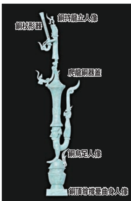
銅壘座倒立鳥足頂尊神像 高度：通高2.53米

構成：由出自1986年發掘二號坑出土的銅鳥足人像、2021年三星堆坑出土的爬龍銅器蓋、2022年八號坑出土的銅頂尊撐曲身人像、銅持龍立人像、銅杖形器五個部分組合而成。