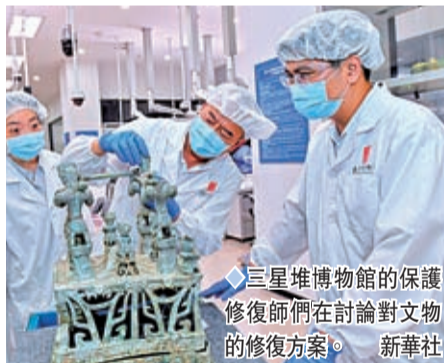
三星堆博物館的保護修復師們在討論對文物的修復方案。

在三星堆新一輪考古發掘過程中，高科技手段的應用屢見不鮮。中國社會科學院考古研究所所長陳星燾9日介紹「中華文明起源與早期發展綜合研究」（即中華文明探源工程）最新進展時亦表示，項目組突破常規檢測方法，採用「貝葉斯統計」和「核密度估計法」對測年結果進行分析，綜合分析考古遺存年代，對重點遺址的關鍵時間節點探索有了新的認識。項目組在對200多個含碳樣品進行篩選、前處理、製備、測量等工作後，共得到幾十個碳十四年代數據，可以認為三星堆遺址埋藏坑器物埋埋的時間大致相當，進一步精確確定為商末周初。