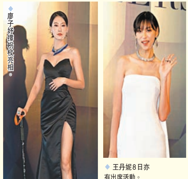
廖子好撐拐杖亮相。