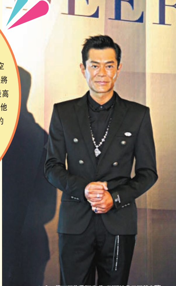
古天樂下月將獲頒發「亞洲影壇非凡貢獻大獎」。

香港文匯報訊(記者阿祖)古天樂、周秀娜、袁澧林、廖子好及王丹妮8日出席珠寶店開幕活動，當中以身穿吊帶中空連身裙的袁澧林最搶眼。而古天樂將獲「紐約亞洲電影節2023」頒發最高榮譽「亞洲影壇非凡貢獻大獎」，他開心表示會繼續為電影做應該做的事，而未來半年他更會多開拍三部戲，都是之前受疫情影響重新復拍的製作。