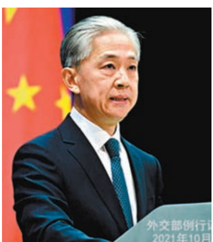
◆外交部發言人汪文斌。

香港文匯報訊（記者 黃書蘭、藍松山）美國有議員煽動拜登政府禁止香港特區行政長官李家超到美國參加將於今年11月在三藩市舉行的APEC峰會（亞太經合組織領導人峰會）。外交部發言人汪文斌在8日例會上回應記者提問時表示，亞太經合組織（APEC）辦會有其組織規則，東道主有責任確保各成員代表順利參會。多名香港立法會議員在接受香港文匯報訪問時批評，美國個別政客明目張膽地鼓吹冷戰思維，與APEC的宗旨完全背道而馳，其手段更愚昧盡顯。他們敦促美方切勿濫用主辦國地位，恪守國際關係基本準則。