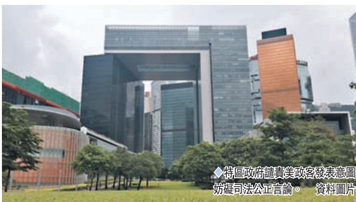
◆特區政府譴責美政客發表意圖妨礙司法公正言論。 資料圖片

據。案件不會因涉案者的政治理念或背景而在處理上有所不同。發言人表示，香港是法治社會，一直秉持有法必依、違法必究的原則，香港司法制度深得國際社會推崇。基本法第八十五條清楚訂明，司法機關依法獨立行使審判權，不受任何干涉，而所有對刑事指控的人都在基本法和香港人權法案的保障下，享有接受公平審訊的權利。「維護國家安全顯而易見是屬於主權司法管轄區的內部事務，因此香港國安法在香港的實施不應受到任何形式的干預。美方政客蠻橫無理的霸凌行徑嚴重違反國際準則，同時粗暴地干涉香港事務和中國內政，公然破壞香港的法治，只會自暴其短，絕不會得逞。」發言人說。