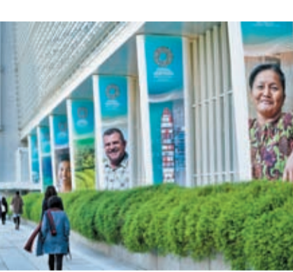
世界銀行預測，2023年中國經濟將增長5.6%。圖為美國華盛頓，行人從世界銀行大樓前走過。

等指標的滿意度均超過80%。中國歐盟商會發布的報告顯示，中國的市場規模、旺盛的需求、研發成果快速商用的能力，以及充足的本土人才等因素，促使大批歐洲企業在中國開展本土研發，近六成受訪企業表示未來五年將增加在華研發支出。中國美國商會的調查結果也顯示，66%的在華企業將在未來兩年保持或增加對華投資。