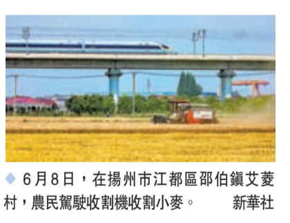
6月8日，在揚州市江都區邵伯鎮艾家村，農民駕駛收割機收割小麥。

習近平指出，鑄牢中華民族共同體意識是新時代黨的民族工作的主線，也是民族地區各項工作的主線。民族地區的經濟建設、政治建設、文化建設、社會建設、生態文明建設和黨的建設等，都要緊緊圍繞、毫不偏離這條主線。無論是出台法律法規還是政策舉措，都要著眼於強化中華民族的共同性、增強中華民族共同體意識。要堅定不移全面推行使用國家統編教材，確保各民族青少年掌握和使用好國家通用語言文字。要統籌城鄉建設布局規劃和公共服務資源配置，創造更加完善的各族群眾共居共學、共建共享、共事共樂的社會條件。