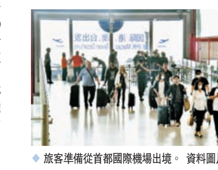
旅客準備從首都國際機場出境。

海南航空計劃於6月21日起開通海口—長沙—倫敦航線，每周一、三、五執行3個往返航班。目前，海航已恢復、新開海口至香港、澳門、曼谷、新加坡、悉尼5條國際及地區客運航線，6月29日還將恢復海口—墨爾本航線。南航目前每天飛歐國際航班123班，涉及85條航線。從區域上看，中美航線一直備受關注，從5月30日起，中美間直航航班增加至每周24個往返航班。中法間航班量目前為每周16班，到6月份將增加到50班，相當於2019年夏季時所允許航班量的51%。隨着國際航班量的逐步恢復，機票價格也在回落，東南亞等熱門航線價格已恢復至2019年水平。另外，對於航線恢復較慢的歐洲、美洲和澳洲等地區，艙位短時間內還將處於供不應求的情況。