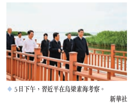
5日下午，習近平在烏梁素海考察。

鑄牢共同體意識 鑄牢中華民族共同體意識是新時代黨的民族工作的主線，也是民族地區各項工作的主線。民族地區的經濟建設、政治建設、文化建設、社會建設、生態文明建設和黨的建設等，都要緊緊圍繞、毫不偏離這條主線。