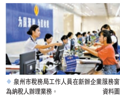
泉州市稅務局工作人員在新辦企業服務窗口為納稅人辦理業務。

分類型看，5月份，企業、個體工商戶分別新辦69.1萬戶和81.7萬戶，同比分別增長27.1%和33.7%。分產業看，第一、二、三產業的新辦涉稅經營主體分別為4.5萬戶、17.3萬戶和130.4萬戶，同比分別增長27.5%、15.3%和26.2%。分行業看，20個行業門類中，17個行業新辦涉稅經營主體數量同比正增長，其中，科學技術服務業、租賃和商務服務業、文體娛樂業增長較快，同比分別增長118%、51.7%和50.2%。分經濟類型看，民營經濟新辦涉稅經營主體150.9萬戶，同比增長25%；外資經濟新辦涉稅經營主體0.3萬戶，同比增長52.9%；國有和集體經濟新辦涉稅經營主體1萬戶，同比增長16.1%。