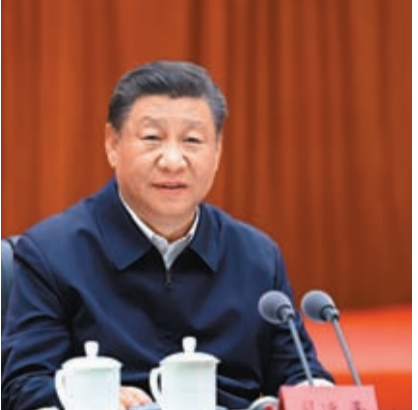
8日上午，習近平在呼和浩特聽取內蒙古自治區黨委和政府工作匯報並發表重要講話。

習近平強調，要牢牢把握黨中央對內蒙古的戰略定位，完整、準確、全面貫徹新發展理念，緊緊圍繞推進高質量發展這個首要任務，以鑄牢中華民族共同體意識為主線，堅持發展和安全並重，堅持以生態優先、綠色發展為導向，積極融入和服務構建新發展格局，在建設「兩個屏障」、「兩個基地」、「一個橋頭堡」上展現新作為，奮力書寫中國式現代化內蒙古新篇章。