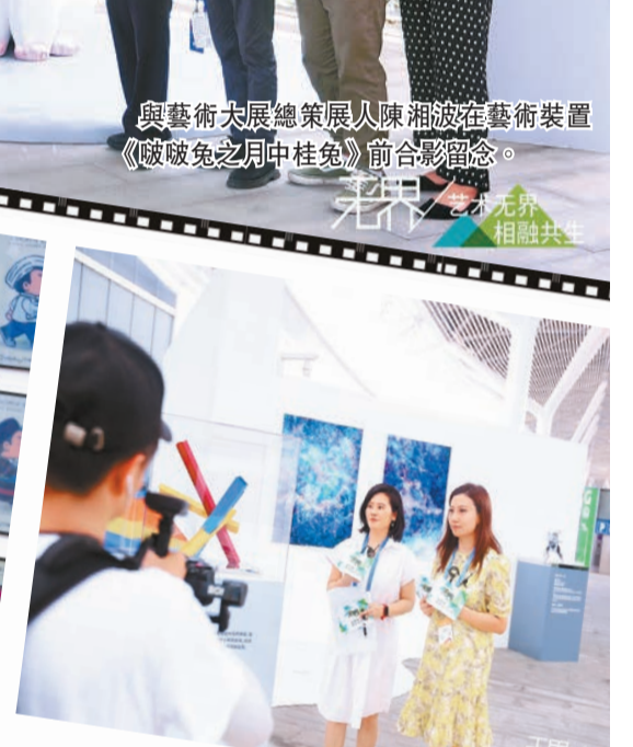
香港商報對藝術大展進行直播現場。