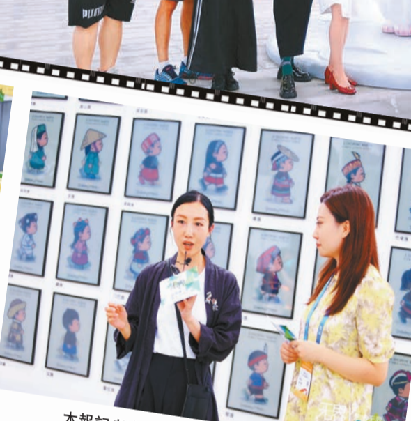
本報記者直播採訪香港知名潮流藝術家鄧卓越。