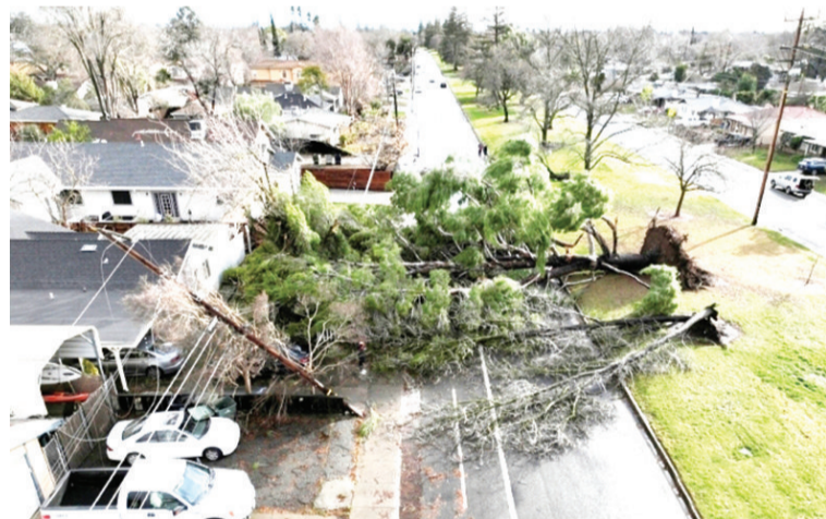
图为当地时间2023年1月8日，美国加利福尼亚州萨克拉门托，因冬季风暴而被连根拔起的大树。

报道称，大多数专家参考美国国家海洋和大气管理局(NOAA)或澳大利亚气象局(BOM)的判断来确认厄尔尼诺现象已经开始。BOM的判定标准相对