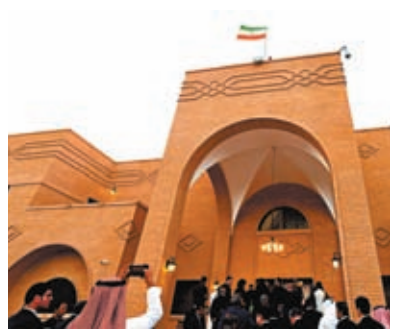
伊朗駐沙特大使館舉行重開儀式。

沙特與伊朗2016年斷交。在中國斡旋下，沙特和伊朗兩國代表今年3月6日至10日在北京舉行對話，中沙伊三方簽署並發表聯合聲明，宣布沙伊雙方同意恢復外交關係。4月6日，沙伊雙方簽署聯合聲明，兩國宣布即日起恢復外交關係。