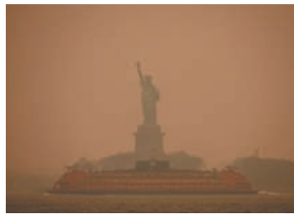
自由神像被煙塵籠罩。網上圖片

報道稱，根據「IQAir」的數據，紐約市的空氣質量指數（AQI）超過150，這一污染水平對老人、幼兒和有呼吸道疾病等敏感人群來說「不健康」。