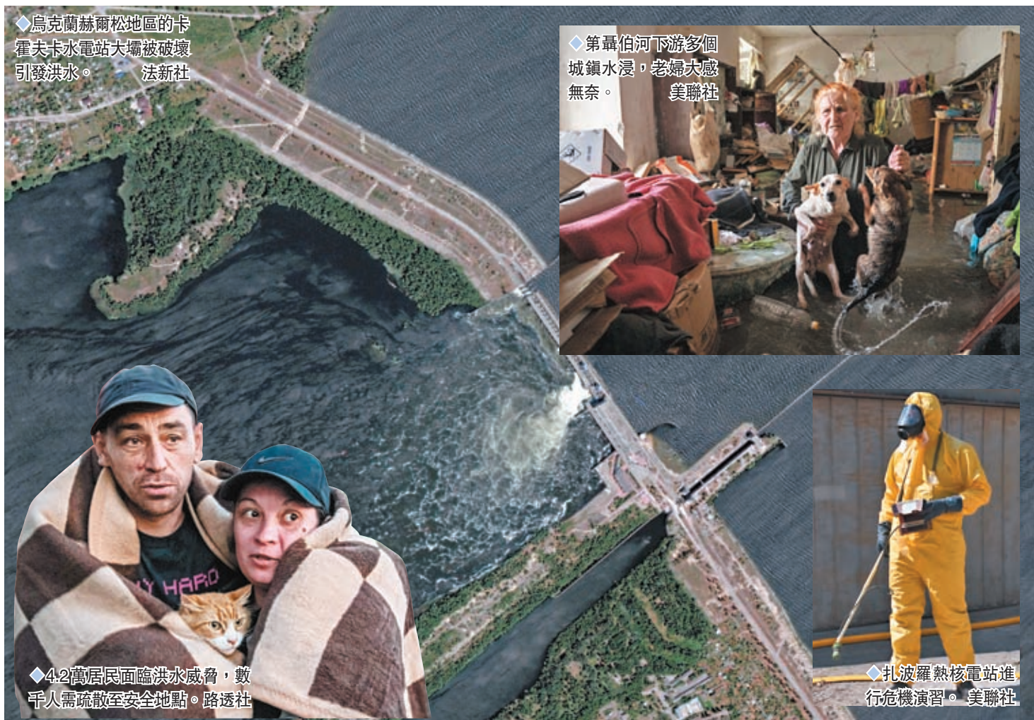
烏克蘭赫爾松地區的卡霍夫卡水電站大壩被破壞引發洪水。

格羅西表示，扎波羅熱核電站附近還有一些能提供冷卻水的替代水源，包括位於水庫上方的大型冷卻池，可以為扎波羅熱核電站提供數月的冷卻水。格羅西據此呼籲各方維護冷卻池的安全，盡量將扎波羅熱核電站的安全風險最小化。