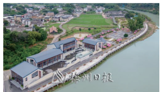
位於西河鎮車龍村的張弼士故居旅遊區，是國家4A級旅遊景區。

業興了，古村也就“活”了。如今，北塘村被評為國家AAA級景區、首批全國鄉村旅遊重點村。2017年至今，當地累計接待遊客150萬人次，帶動消費690多萬元，解決就業人數120多人，帶動就業人數130多人，當地村民的幸福感和廣大遊客的體驗感都大幅提升。