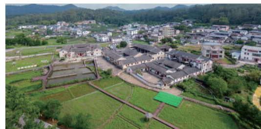
近年來，西河鎮北塘村採取“藝術活化古村”形式，打造可賞、可居、可玩的新型鄉村藝術片區——“南宋古村·藝術北塘”。

從大埔縣城出發，走過西河鎮北塘大橋，來到具有1300多年歷史的西河鎮北塘村。近期，北塘藝術柚倉、翰林草堂落成揭幕儀式暨山水青華當代藝術邀請展、“清風雅韻”翰林草堂全國扇面作品集展示系列活動在北塘村舉行。