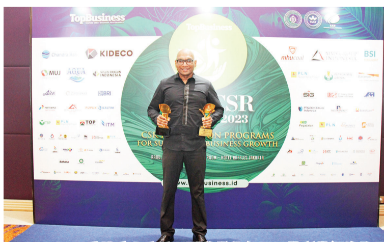
Modernland 房地产上市公司副总裁达尔马及其所获得的奖项

业社会责任方案),对公司业务策略的一致性标准进行评估,对政策的吸收程度、ISO 26000:2010(关于企业社会责任的国际指导文件)规定采用企业社会责任政策和计划的情况;社会责任(无论是由企业社会责任部门执行还是企业社会责任以外的其它部门与ISO26000 SR核心条款/主题相关的声明/认可),企业社会责任治理体制(涉及规划、实施、监测、报告等),企业社会责任采用CSV(创造共享价值/与利益相关者共享互惠互利)理念的水平,以及可作为示例的领先企业社会责任创新/可推荐