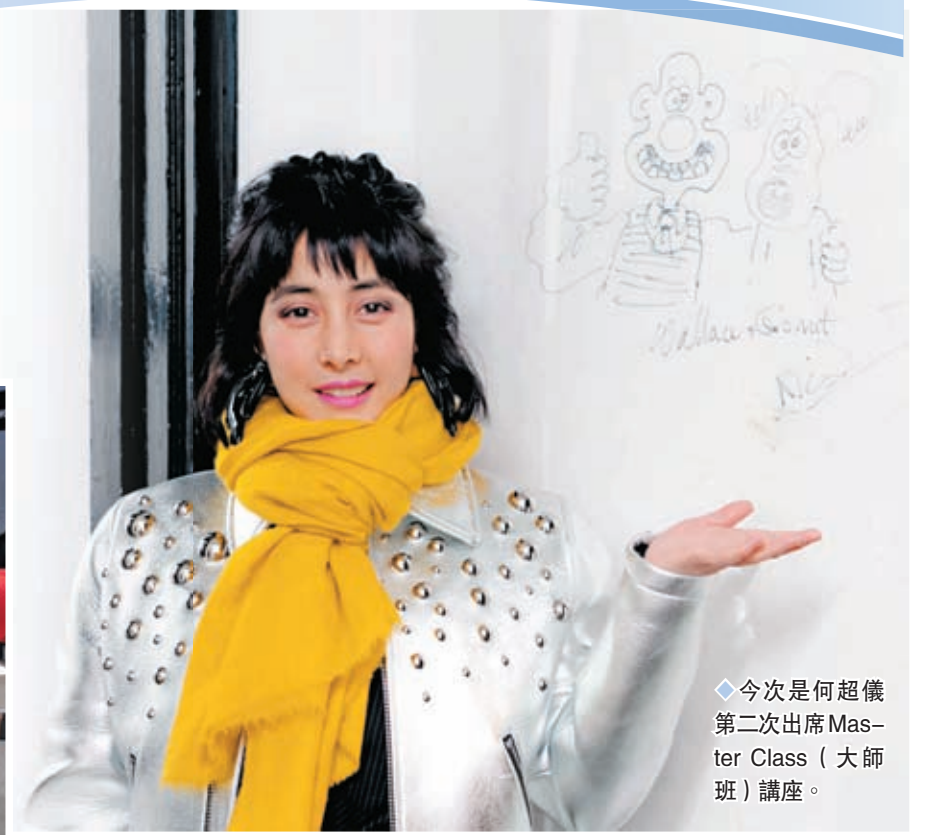
今次是何超儀第二次出席 Master Class ( 大師班 ) 講座。