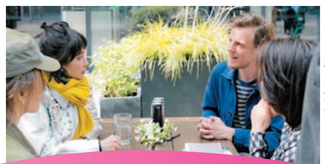
講座過後，不少學生在場外等超儀，意猶未盡要再與她討論交流。