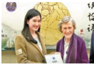
◆尤德爵士夫人（右）在《世說論語》勉勵年輕人：只要永不言棄，有志者事竟成。

夫人相信只要永不言棄，有志者事竟成。她接受電視特輯《世說論語》訪問的時候，不忘勉勵年輕人說：「我想向正在奮鬥的年輕人說，即使一開始沒有成功，或因考試失利而得不到你希望獲取的獎勵，也不要放棄，要再接再厲。因為堅持下去會得到回報的，努力爭取想要的東西，永不言棄。別去想我做不到，只要勇往直前。有時反而開闢了意想不到的機會之門，開始時的失敗又焉知非福！」