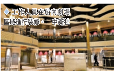
工作人員在船內劇場區域進行裝修。

香港文匯報訊 據澎湃新聞報道，6月6日出塢的中國大型首製郵輪「愛達·魔都號」，總噸位為13.55萬噸，入級英國勞氏船級社（LR）和中國船級社（CCS）。其總長323.6米，型寬37.2米，最大吃水8.55米，最大航速22.6節，最多可容納乘客5,246人，擁有客房2,125間；採用吊艙式電力推進系統，配備2台16.8兆瓦、