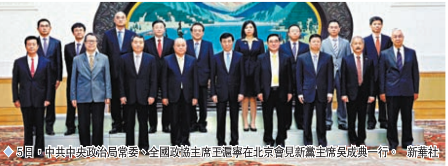
5日，中共中央政治局常委、全國政協主席王滬寧在北京會見新黨主席吳成典一行。

吳成典：只有統一 台灣才有出路 吳成典表示，統一歷史大勢，只有統一，台灣才有出路。新黨旗幟鮮明主張和平統一，堅決