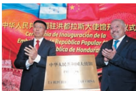
當地時間6月5日上午，中國駐洪都拉斯使館開館儀式在特古西加爾巴舉行。

隨著兩國關係深入發展，未來將會有更多合作機遇。洪都拉斯總統府事務部部長（即內閣首席部長）魯道夫·帕斯托爾表示，中國提出的共建「一帶一路」倡議契合洪方需求，雙方已有多家企業在基礎設施合作等方面達成協議；在科潘古城瑪雅文明遺址的考古合作，生動展現了雙邊人文交流合作成果。目前洪都拉斯在推動落實「國