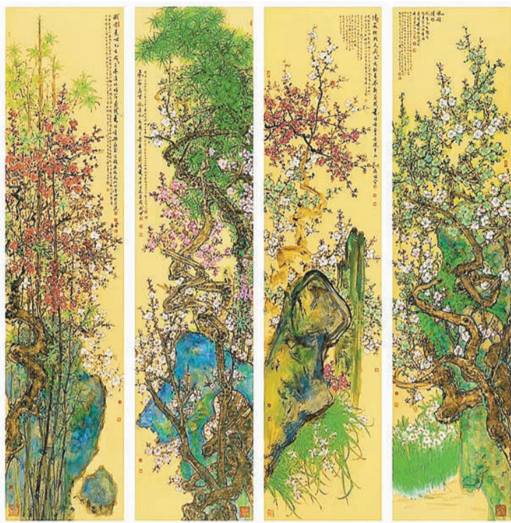
▶蕭暉榮作品《風韻清殊》、《清嚴標格》、《氣節高堅》、《鐵骨素心》，設色黃蠟染箋，2019年，各138×34.5厘米。