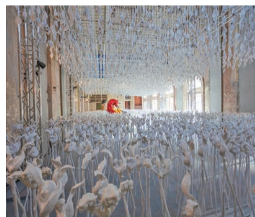
帕翠西亞·皮奇尼尼作品《天野》，2021年。此圖攝於2022年澳洲墨爾本福林德斯街車站「不斷重複的奇蹟」展覽。

「希望」是皮奇尼尼在香港的首個個展，展品分布於大館賽馬會藝方各個展廳，不乏大型作品，如一件巨大的沉浸式裝置《天野》（Celestial Field），有4500株花莖分別從地板上撐起及從天花板垂下，恍如把觀者一擁入懷，藉以探問何謂進步的本質。另外，藝術家對大館標誌性的螺旋樓梯作出回應創作，從頂層天花板懸掛一個高達20米、以不同顏色假髮編織而成的裝置，同樣引人深思。