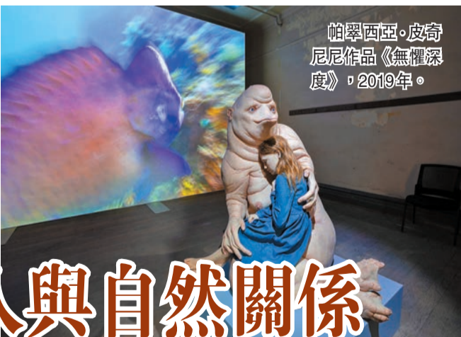
帕翠西亞·皮奇尼尼作品《無懼深度》，2019年。

人類干預自然會帶來什麼後果？澳洲藝術家帕翠西亞·皮奇尼尼的創作，試圖探索人類干預自然所帶來的難測後果，她對科學進步、人類破壞大自然等提出質問，並以雕塑、繪畫及流動影像作品呈現這些奇幻的後果。現正舉辦的展覽「希望」展示逾50件充滿細節和想像力豐富的超現實主義作品，展品涵蓋不同媒介，包括雕塑、繪畫、流動影像，為觀眾呈現一個奇幻的世界。 記者：YEE