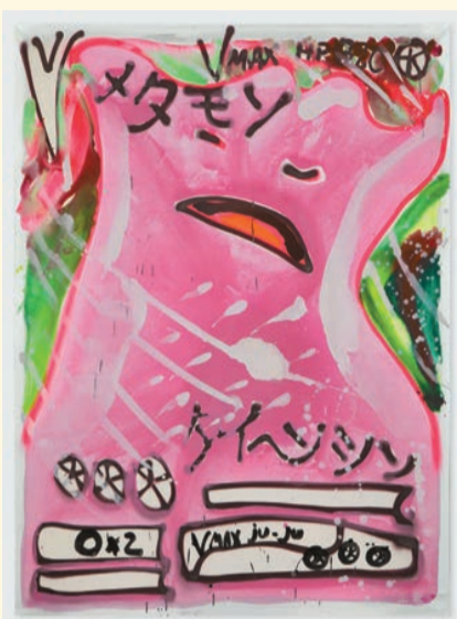
凱瑟琳·伯恩哈特具卡通色彩的作品《百變怪 絕群壓軸 Juju》，2021年。（圖片由凱瑟琳·伯恩哈特、卓納畫廊及CANADA畫廊提供）