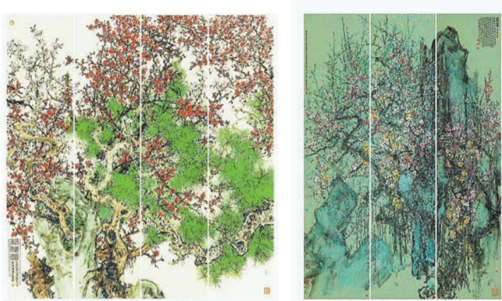
▲蕭暉榮作品《松梅頌》（四屏通景），設色淡黃蠟染箋，2019年，138×34.5厘米×4。