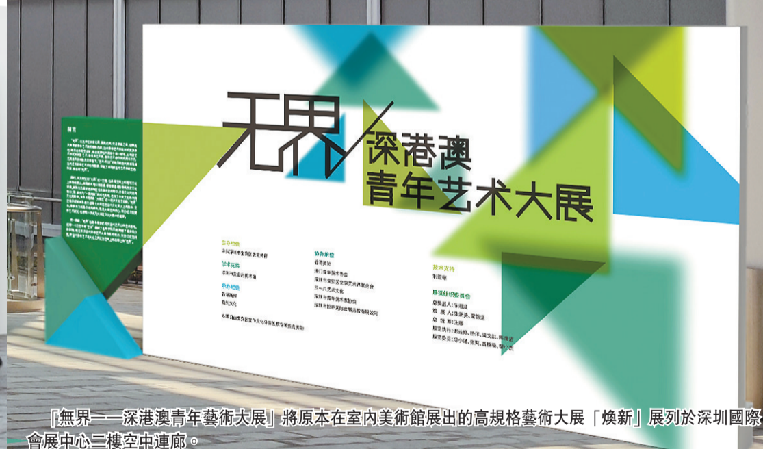
「無界——深港澳青年藝術大展」將原本在室內美術館展出的高規格藝術大展「煥新」展列於深圳國際會展中心二樓空中連廊。