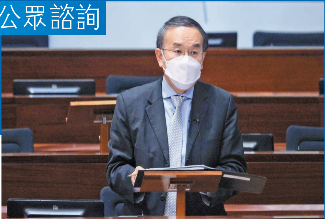
許正宇表示，金管局正積極推進「多種央行數碼貨幣跨境網絡」(mBridge)。

構建更活躍金融科技生態圈方面，金管局正積極推進「多種央行數碼貨幣跨境網絡」(mBridge)，與此同時，