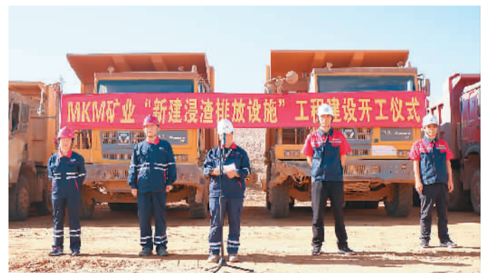
由中铁八局承建的MKM矿业新建浸渣库一期工程日前在刚果（金）卢阿巴拉省科卢韦齐市东部举行开工仪式。该项目建成后，可防止矿渣向周边水域任意排放，更好保护当地生态环境。

中国，该博览会是专为中国企业与欧洲伙伴推动海外贸易与投资的展览平台。参展商来自工业机械、建材五金、纺织服装、电子产品等8个行业领域，由欧洲贸易商和商务代表等组成的参观者人数预计超过2万。