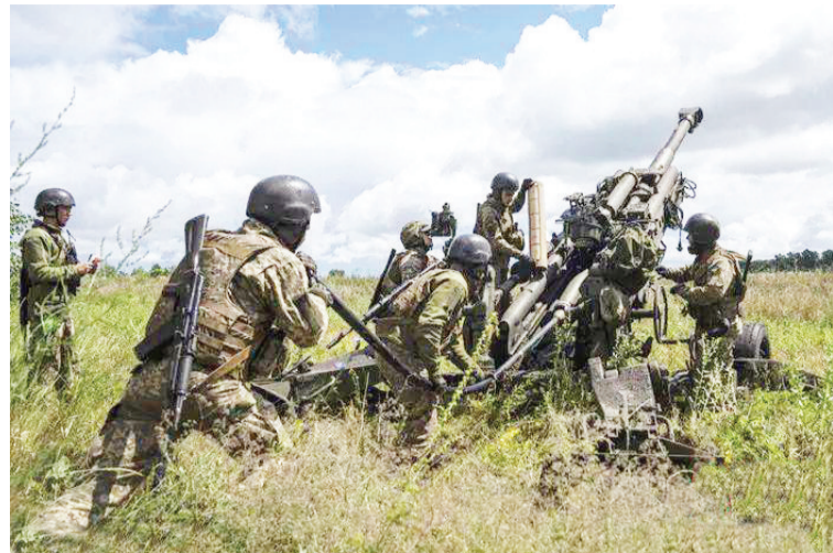
资料图:乌克兰军人准备在哈尔科夫地区使用美国提供的M777榴弹炮向俄罗斯阵地开火。

俄国防部称,陆航、强击航空兵和战役战术航空兵兵力、导弹兵和炮兵以及重型喷火系统对乌方发起综合火力打击。通过“东”军队集团分队的行动,乌方被阻止,未达成所下达的任务。