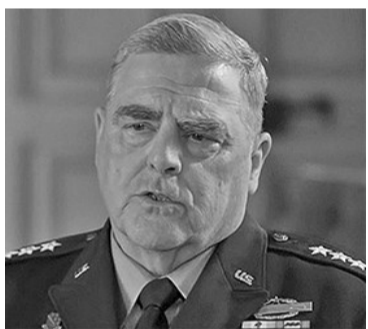
CNN报道所配米利5日接受采访视频中的画面

据中国载人航天工程办公室消息，前期撤离空间站组合体、已独立在轨飞行33天的天舟五号货运飞船，于北京时间2023年6月6日3时10分，完成与空间站组合体再次交会对接。目前，空间站组合体状态良好，后续将按计划开展各项工作。来源：央视新闻客户端