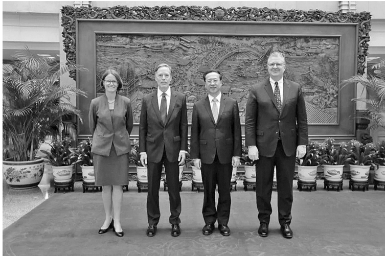
6月5日，美国国务院亚太事务助理国务卿康达、白宫国安会中国事务高级主任贝莎兰访华，中国外交部副部长马朝旭会见，外交部美大司司长杨涛举行会谈。