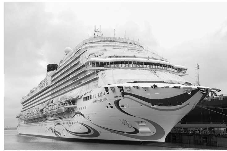
这是6月6日拍摄的首艘国产大型邮轮“爱达·魔都号”。当日，由中国船舶外高桥造船有限公司建造的首艘国产大型邮轮“爱达·魔都号”出坞，标志着国产大型邮轮项目全面转入码头系泊调试阶段，预计将于今年年底完工交付。