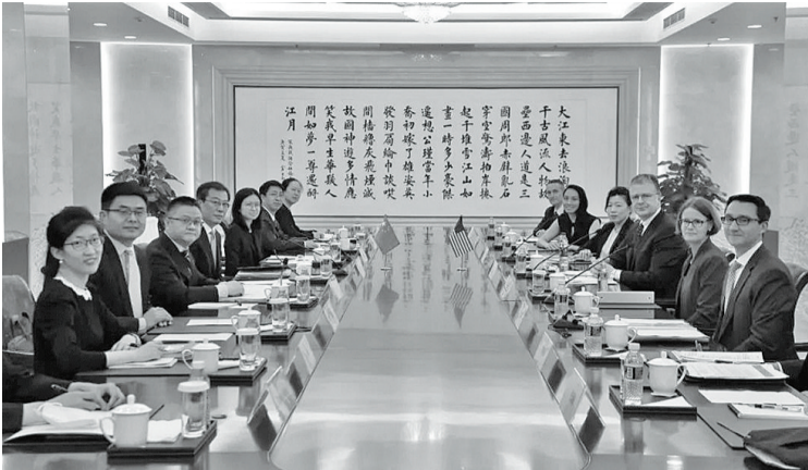
双方围绕按照两国元首去年11月巴厘岛会晤共识推动改善中美关系、妥善管控分歧等进行了坦诚、建设性、富有成效的沟通。中方就台湾等重大原则问题阐明严正立场。双方同意继续保持沟通。