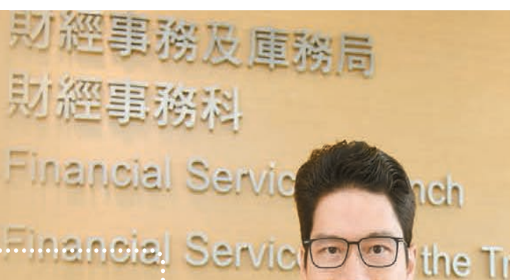
▲陳浩濂表示，一系列制度優勢有助於家族辦公室業務發展成為香港金融業的重要支柱。

在特區政府非常積極且全方位地吸納內地及海外家族辦公室來港之際，財經事務及庫務局副局長陳浩濂日前接受本報專訪時表示，香港擁有一系列制度優勢，家族辦公室業務將成為香港金融業的重要支柱。他強調，自己不同意香港在吸納家族辦公室業務方面過度側重於內地的觀點；而且，與新加坡相比，香港對家族辦公室的稅務減免政策等較為優勝。香港商報記者 鄭偉軒