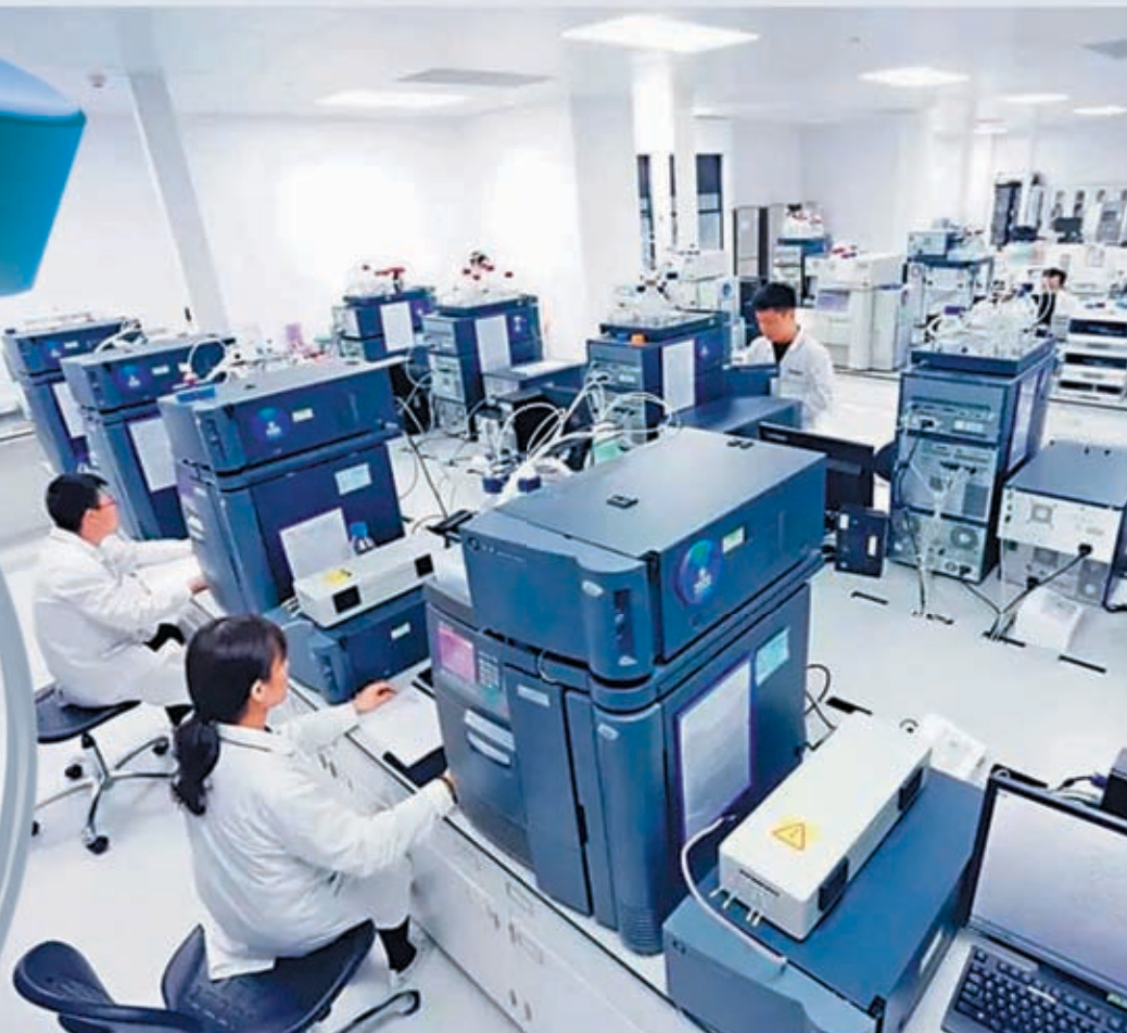
◆ 齊魯製藥將向美提供抗癌藥順铂。