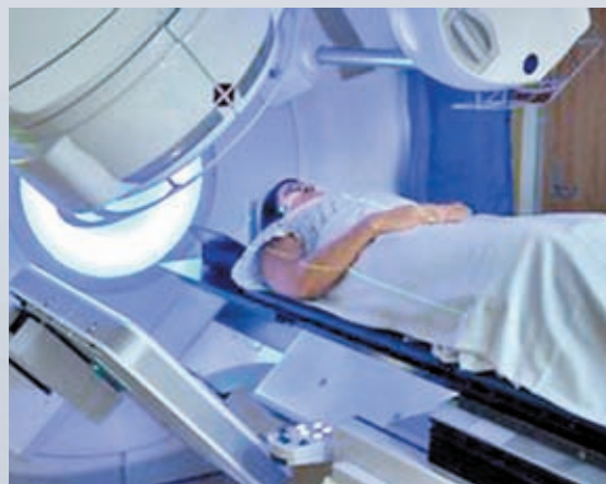
◆ 即使在美國大型癌症中心，抗癌藥也供不應求。

美國藥物嚴重短缺已引起白宮和國會注意。據報總統拜登政府已成立小組，研究向藥廠提供減稅優惠，以支撐藥物供應鏈。美國仿製藥製造商、供應鏈專家和患者權益倡導組織，近期亦開始與國會議員討論藥物供應問題。