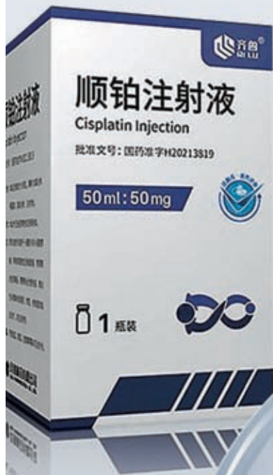
◆ 齊魯製藥其中一款順铂產品。

香港文匯報訊 美國食品和藥物管理局（FDA）日前宣布，局方已向中國藥企齊魯製藥批出緊急許可，直接對美國進口一款抗癌藥物，以緩解美國的藥物嚴重短缺情況。今次是中國藥企首次以國內市場在售產品，向美國進行短缺藥供應。《華爾街日報》等美媒指出，今次緊急「開綠燈」再次暴露美國藥物過度依賴進口、供應鏈問題遲遲未有解決，藥物短缺問題持續，只會威脅更多癌症患者的生命。