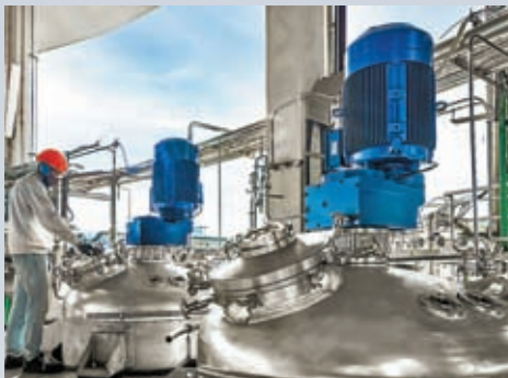
◆ Olon 將部分能源成本轉嫁藥廠，但不排除藥廠會因而停產。

香港文匯報訊 全球能源價格在通脹潮中一度居高不下，影響到歐美不少基礎藥物生產。《華爾街日報》指出在今年初，阿莫西林、頭孢菌素、退燒藥和鎮痛藥等基礎藥物，在歐美多地都供不應求。藥廠指出由於能源價格高企，生產這些需求量很少波動、利潤率微乎其微的基礎藥物，幾乎無利可圖甚至虧損，產量自然會打折扣。