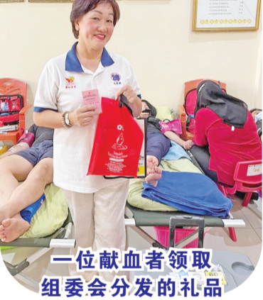
一位献血者领取组委会分发的礼品

社会公益活动是例行举办的活动,其中是与印尼红十字会举办献血活动,为了支持印尼红十字会血液储备的需求,于是再度举办献血活动。然后,组委会对各个献