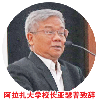
阿拉扎大学校长亚瑟普致辞

【本报讯】6月3日,印尼阿拉扎大学孔子学院在阿拉扎大学三楼礼堂举办首场中资企业招聘会,举办本次活动旨在协助印尼中资企业招聘高校毕业生,发挥孔子学院社会责任,探索校企合作新模式。