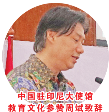
中国驻印尼大使馆教育文化参赞周斌致辞