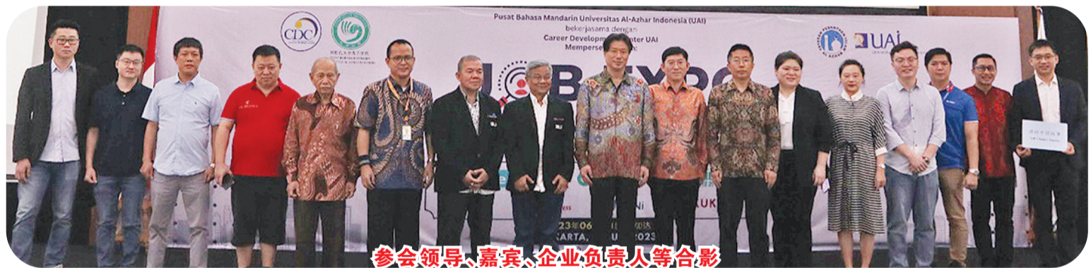
参会领导、嘉宾、企业负责人等合影