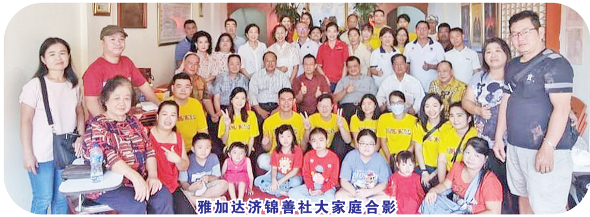
雅加达济锦善社大家庭合影

【本报讯】雅加达济锦善社(YEMI)和雅加达首都专区印尼红十字会重启例行进行的活动议程,以献血行动为社会服务。