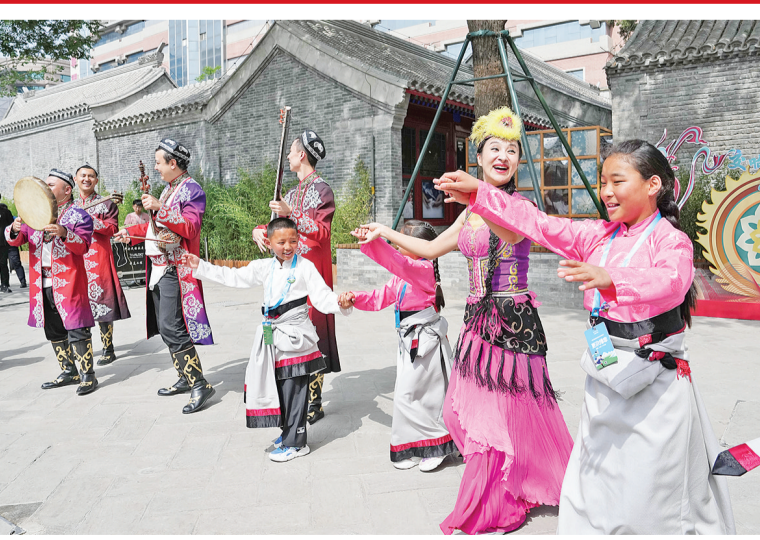
孩子们与参加演出的民族艺术家们共同跳舞

在体验馆,40名藏族青少年进行了一场别样的文化交流。体验馆采取“展览+体验”的方式,孩子们不仅可以通过丰富的历史图片、珍贵实物史料和视频资料,来了解党的百年民族工作,还可以身临其境感受中华民族优秀传统文化中的共有精神标识与共享文化符号。