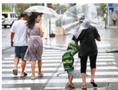
沖繩市面橫風橫雨。

沖繩縣政府已針對南城市等4市町村發布警戒等級次高的「避難指示」。沖繩縣所有公立中小學校6月1日停課，當地多個景點已於1日下午開始關閉，包括著名的海洋博公園、沖繩美麗海水族館等。