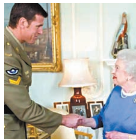
史密斯曾在白金漢宮獲英女王伊利沙伯二世接見。