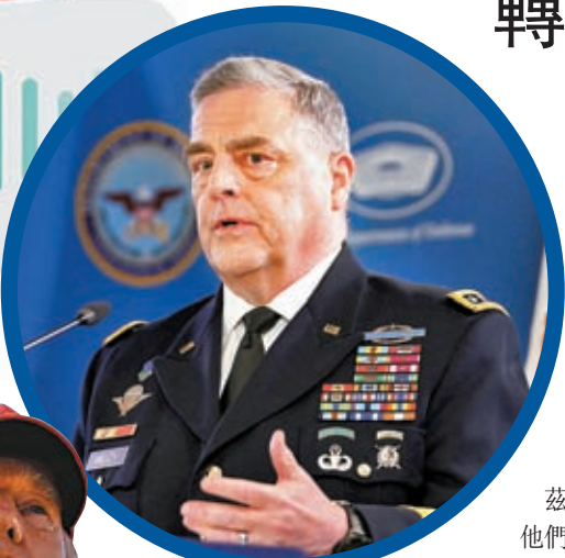
特朗普在錄音稱自己掌握的文件中包含米利（圓圖）起草的攻擊伊朗計劃。