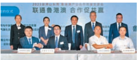
魯港澳產業合作對接交流會在香港舉行。現場簽約9項重大項目，項目總金額達93億元人民幣。

會上有9項重大項目現場簽約，涉及新能源新材料、工業互聯網、產業人才合作等方面。尤其是浪潮雲洲與澳門融貫簽署的「星火鏈網」應用項目，服務中國澳門、葡語系國家和東南亞等地區，為近千家企業節省辦公能耗約23%，對推動跨境數字貿易合作作出山東貢獻；荷澤水務集團與香港協合新能源集團簽署的「新型儲能智能製造工廠」項目，總投資額達30億元，助力山東省產業綠色低碳發展；會上，浪潮智能終端等5家企業作項目推介，吸引