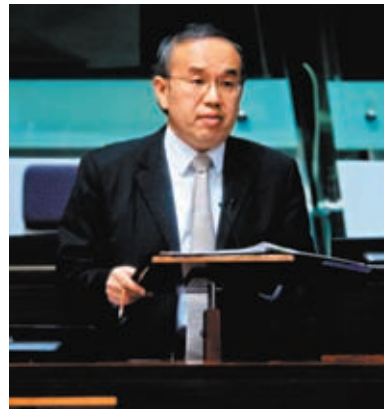
財庫局局長許正宇指，香港投資管理公司自成立以來，已接獲不少機構提交投資計劃書。

香港文匯報訊（記者 馬翠媚）香港特區政府今年施政報告提出成立香港投資管理有限公司，香港財庫局局長許正宇5月31日透露，香港投資管理公司自成立以來，已接獲不少機構提交投資計劃書，包括創科及金融科技企業，雙方已開展初步洽談，未來會根據董事會訂定的投資準則考慮作出投資。