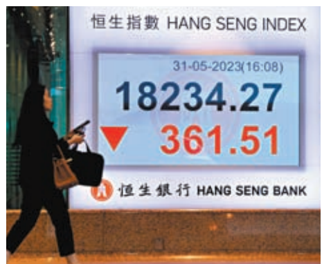
恒指5月31日曾跌逾500點，最終全日下跌361點或1.94%。

亦一度跌逾500點而墮入技術熊市區，最終收報18,234點，跌361點或1.94%。整個5月，恒指累跌1,660點或8.3%。