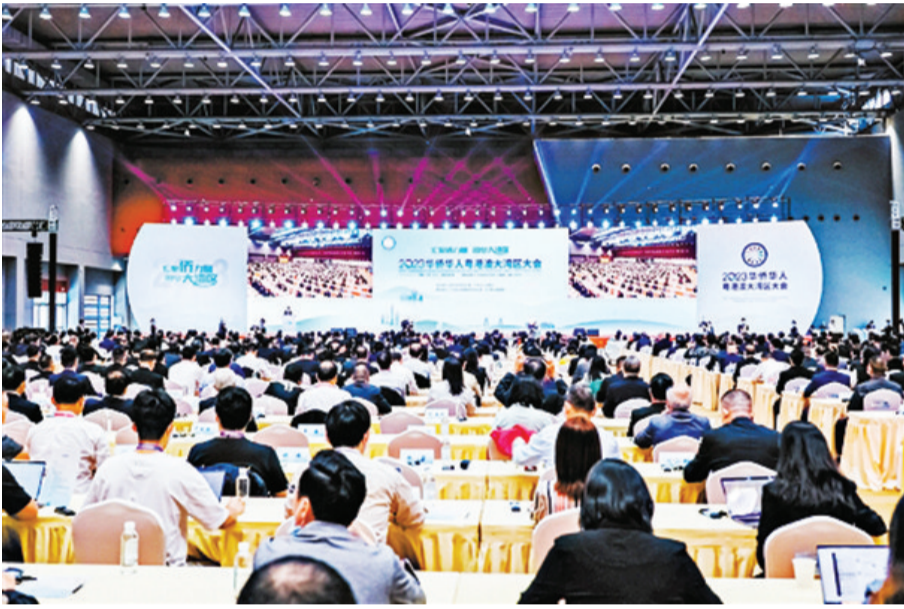
5月17日上午,由国务院侨办和广东省人民政府主办的2023华侨华人粤港澳大湾区大会在江门召开。