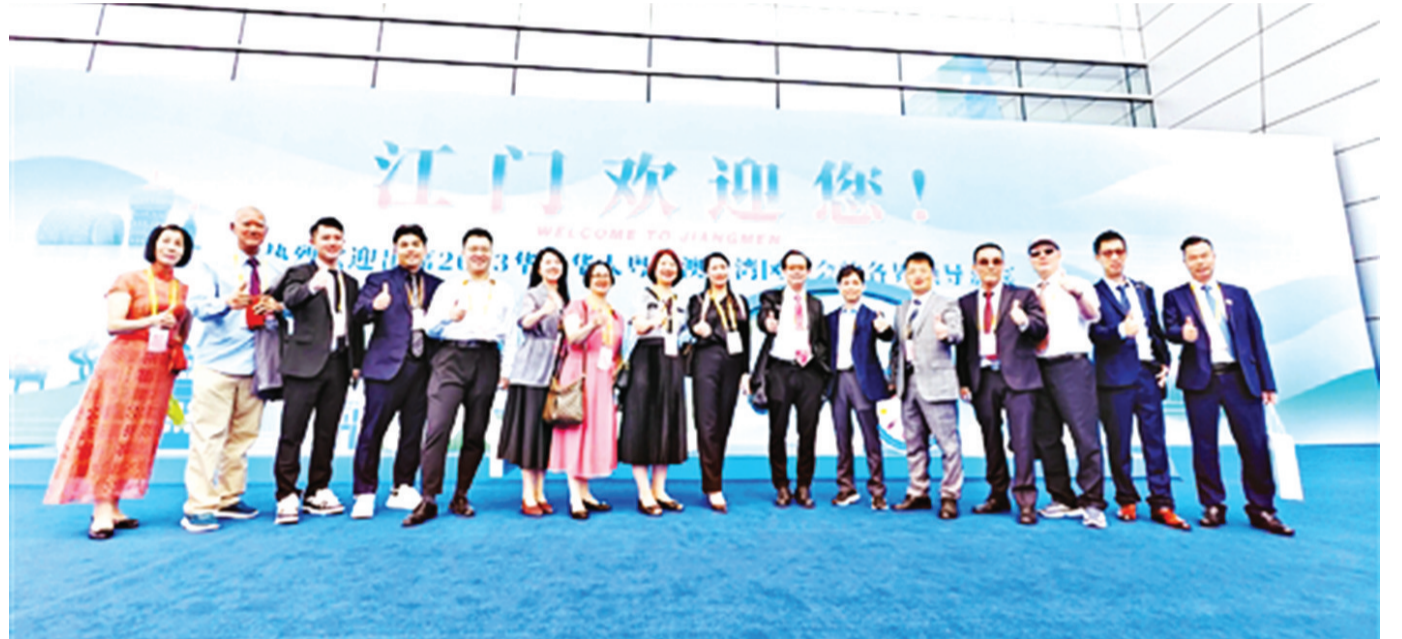
带着赤子之心和真知灼见,参会的嘉宾和侨胞对大湾区的未来充满信心。

5月17日上午,由国务院侨办和广东省人民政府主办的2023华侨华人粤港澳大湾区大会在江门召开。本次大会以“汇聚侨力量,圆梦大湾区”为主题,来自90个国家和地区的约700名海外侨胞共聚一堂,共叙乡情、共谋发展。