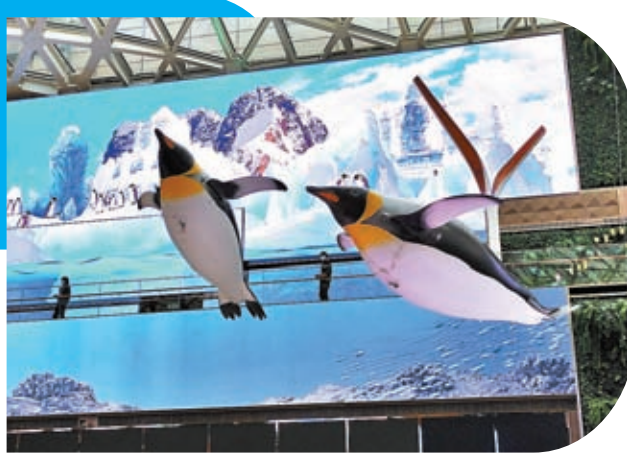
◆企鵝游來游去，狀甚有趣。