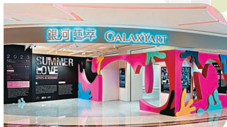
◆夏日戀曲——「藝術家駐場」壁畫現場創作及展覽

今年初夏，五位港澳知名當代藝術家齊聚「澳門銀河」綜合度假城，以「夏日」與「愛」為主題駐場即席創作，各自以超過十米長的牆壁作為分享靈感和創意的舞台，打造共五十米長的大型壁畫藝術作品。日前，夏日戀曲——「藝術家駐場」壁畫現場創作及展覽活動正式於銀河時尚匯的藝文空間——「銀河藝萃」揭幕，揭幕儀式上首次展出了一幅由五人聯合創作的大型畫作，融合了各人獨特的作畫風格和技法合力呈獻「夏日戀曲」這一主題，表達了港澳藝術家之間的創作交流熱烈之寓意。