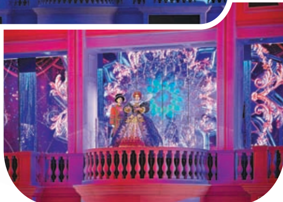
◆表演藝人在澳門倫敦人水晶金殿現身