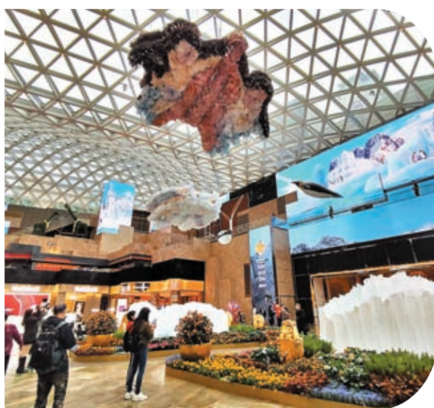
◆在視博廣場中的空中海洋SHOW