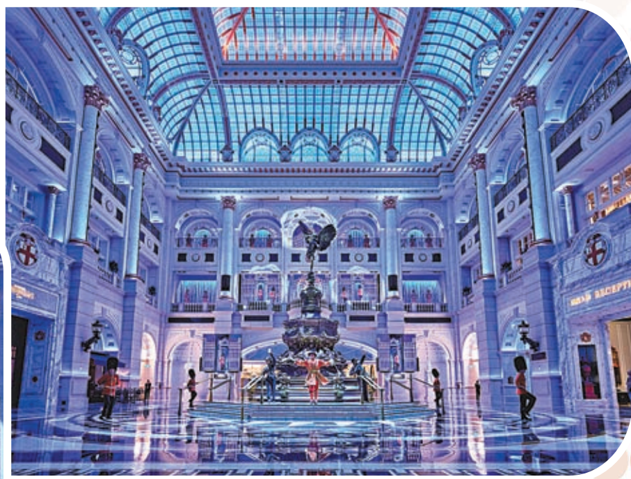
▲澳門倫敦人呈獻「皇家衛兵換崗」表演，於水晶金殿重現極具英倫特色的儀式盛況。