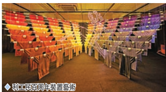
◆利工民百年裝置藝術