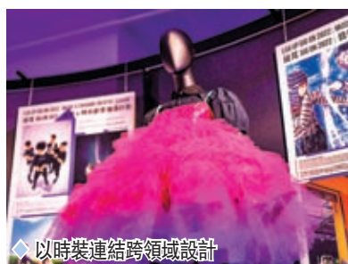
◆以時裝連結跨領域設計