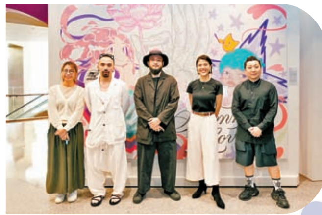
◆一幅由五人聯合創作的大型畫作

五位才華橫溢的港澳藝術家歷時六周，在「銀河藝萃」揮灑創意，帶領藝術愛好者走進他們的靈感世界。花朵、動物、海洋、星空等夏日元素透過藝術家的不同筆觸，巧妙地變化成各式線條、色塊、圖形和文字的組合，傳遞藝術家們對「夏日戀曲」這一主題的詮釋，今次展覽將一直持續至6月30日，免費對公眾開放。