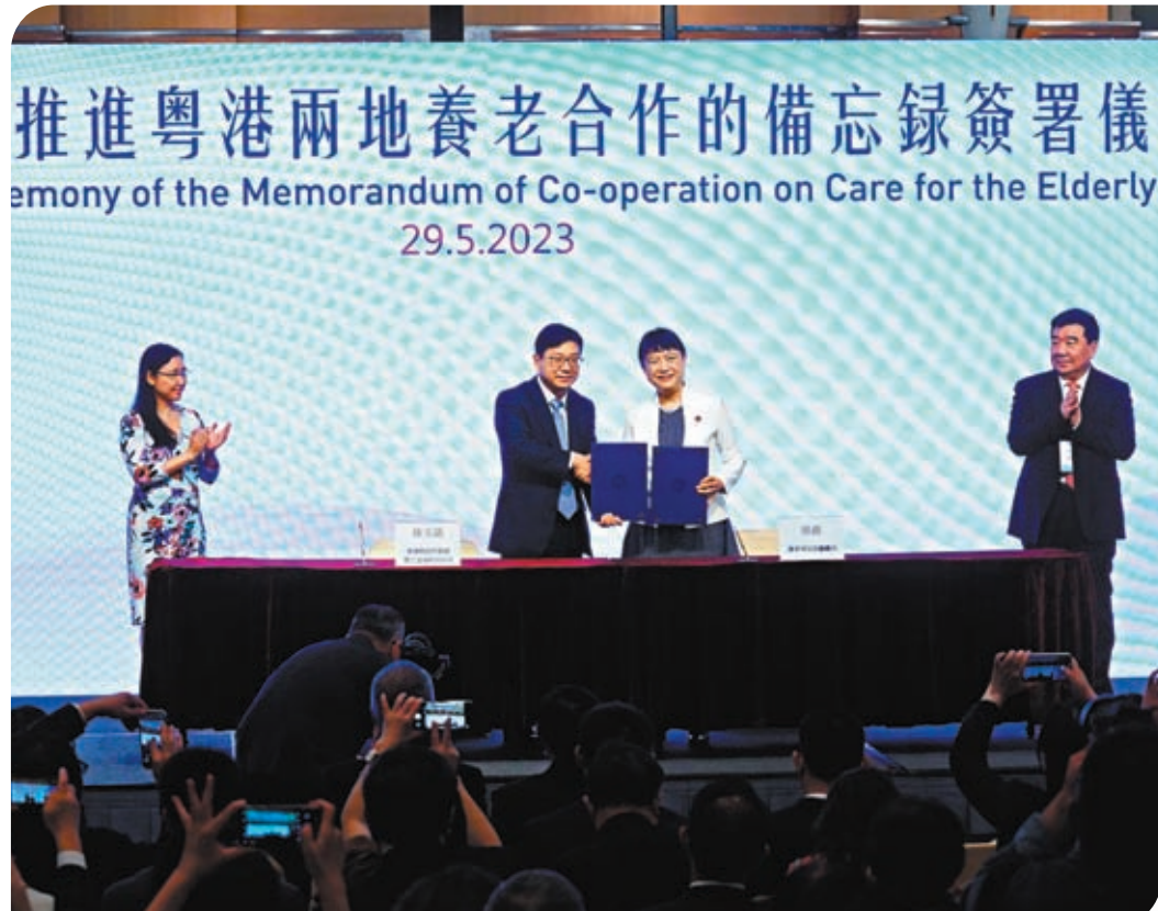
◆29日，特區政府勞工及福利局局長孫玉茜（左二）與廣東省民政廳廳長張晨（右二）簽署《關於共同推進粵港兩地養老合作的備忘錄》。