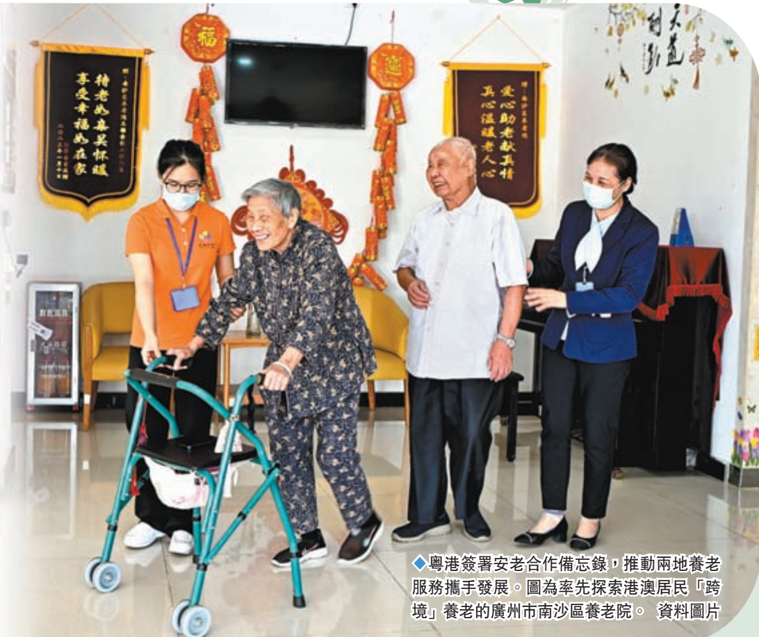
◆粵港簽署安老合作備忘錄，推動兩地養老服務攜手發展。圖為率先探索港澳居民「跨境」養老的廣州市南沙區養老院。

香港特區政府29日早舉行香港社福開新篇高峰會暨香港社福界心連心大行動成立典禮，凝聚香港、內地及國際持份者就社福議題進行交流分享。香港特區政府勞工及福利局局長孫玉茜29日早與廣東省民政廳簽署《關於共同推進粵港兩地養老合作的備忘錄》，鼓勵兩地養老服務發展。