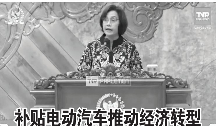
补贴电动汽车推动经济转型

贸易部长祖基菲里(Zulkifli Hasan)也曾透露说,进口200万吨大米的决定,已于2023年3月24日举行局部内阁会议时,得到了佐科维总统的同意。(Sm)