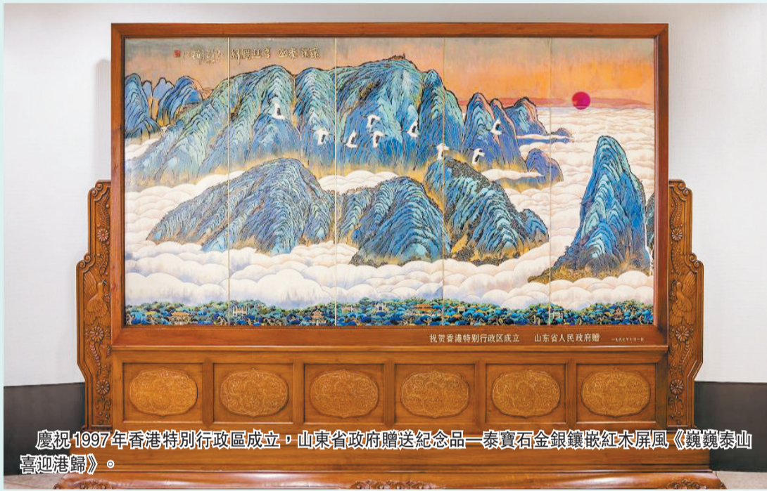
慶祝1997年香港特別行政區成立，山東省政府贈送紀念品—秦寶石金銀鑲嵌紅木屏風《巍巍泰山喜迎港歸》。

近年來，隨着滬港通、深港通、債券通和基金互認等先行先試政策不斷推出，香港與內地資本市場互聯互通渠道逐步增多。並且，在「一帶一路」倡議、粵港澳大灣區建設引領下，香港同內地互補優