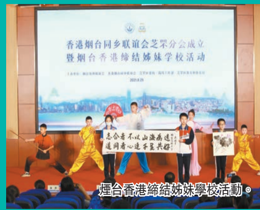
煙台香港籍婦女學校活動。

時光荏苒，山東與港澳形成了深厚的歷史淵源與合作情誼。經過多年的鞏固和發展，三地交流合作枝繁葉茂、碩果累累，相信將同心與共書寫更美好的華章。