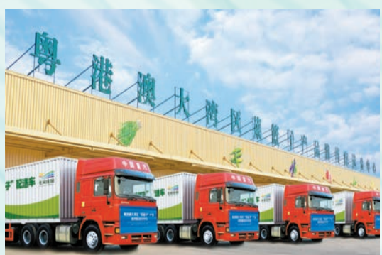
山東是粵港澳「菜籃子」的重要供應地。

「共享發展，改善民生」是粵港澳大灣區發展規劃綱要提出的六項基本原則之一。多年來，魯港澳在民生保障、社會治理方面交流密切：從「菜籃子」到「藥匣子」，從「魯警」到各行業人才交流，民生助力彰顯着三地深厚的情誼。