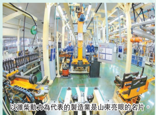
以濰柴動力為代表的製造業是山東亮眼的名片。

作為產業、城鄉、區域結構與全國相似度極高的北方大省，山東是讀懂中國的窗口。從成績單上看，山東2022年地區生產總值達到8.74萬億元，具有較為突出的比較優勢。如三次產業上，山東是中國唯一農業總產值超萬億元的省份，也是唯一擁有全部41個工業大類的省份，在全國工業和製造業版