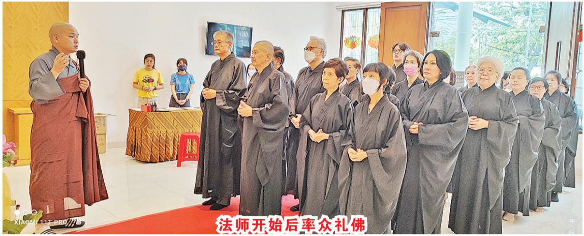
法师开始后率众礼佛