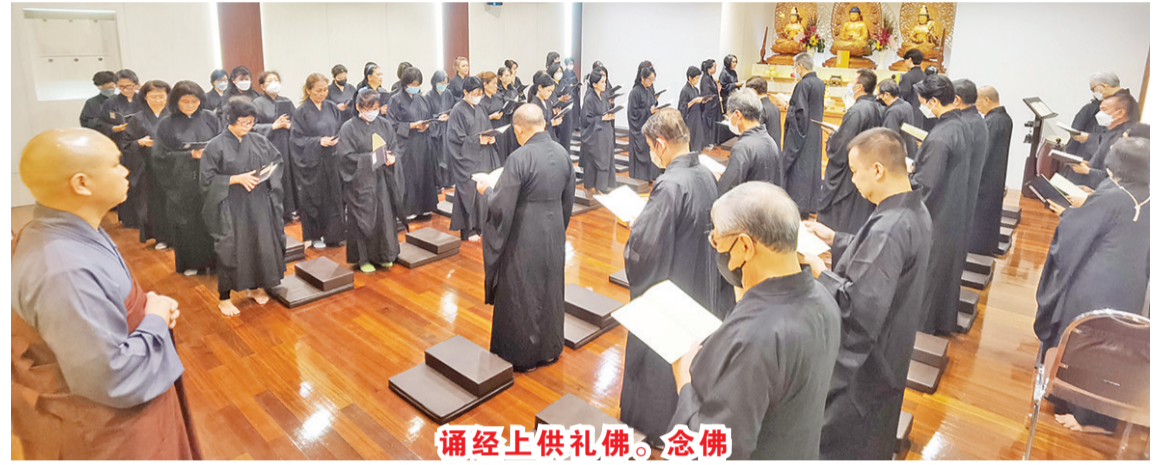
诵经上供礼佛。念佛