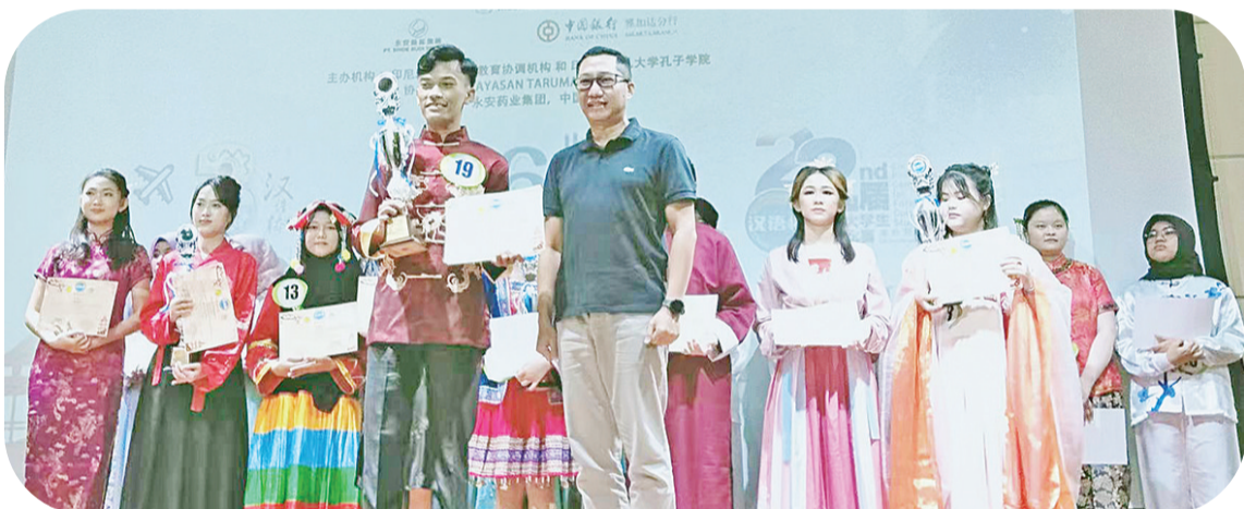
菲力院长为大学组二等奖选手颁奖