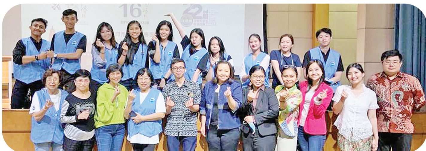
小学、中学组部分评委与工作人员合影