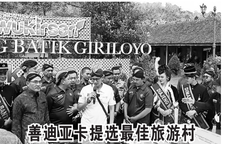
善迪亚卡提选最佳旅游村 5月28日,旅游业与创意经济部长善迪亚卡(Sandiaga Uno)在日惹特区班图尔县(Bantul)的Wukirsari乡签署铭文,它被评为最佳旅游村。

煤炭参考价格平均上涨34.76%,镍参考价格价格上涨7.12%。”然而石油和林业经历了不同的遭遇。报告中,2023年首四个月石油开采业缴付价值达40.9万亿盾,同比下降17.25%。而本年度的石油开采业上缴指标是96.13万亿盾。同样,林业部门在同时期实际缴付额达到1.38万亿盾,比2022年同期下降8.54%。在2023年度林业开采上缴指标是5.161万亿盾。渔业部门也经历了类似的情况。今年首四月的上缴额仅为182.4亿盾。与去年同期相比下降96.1%。今年渔业部门的国家非税收入指标是3.5万亿盾。渔业部门上缴额的下降是由于收集渔业的国家非税收入机制发生了变化所致。(lrw)