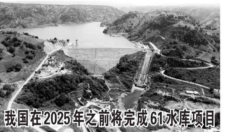
我国在2025年之前将完成61水库项目 图示:南苏省杰内彭托县(Jeneponto)的Karalloe水库在5月27日的情景。如悉,公共工程与民居部定下指标,61座水库必须在2025年之前建成,目前已有36座水库已建成并投运了。