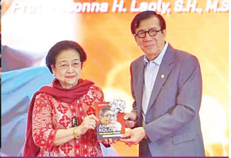
司法与人权部长发布政治传记 5月27日,司法与人权部长雅松纳(Yosanna H. Laoly/右)向我国第五任总统梅加瓦蒂,赠送他刚刚出版题为《追梦小子》的政治传记。