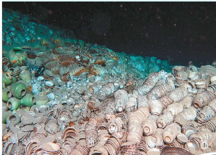
图①、图②：南海西北陆坡一号沉船内部（2022年10月摄）。

用科技之钥，打开历史之门。发现南海西北陆坡一号、二号沉船的过程，是一次深海科技与水下考古的完