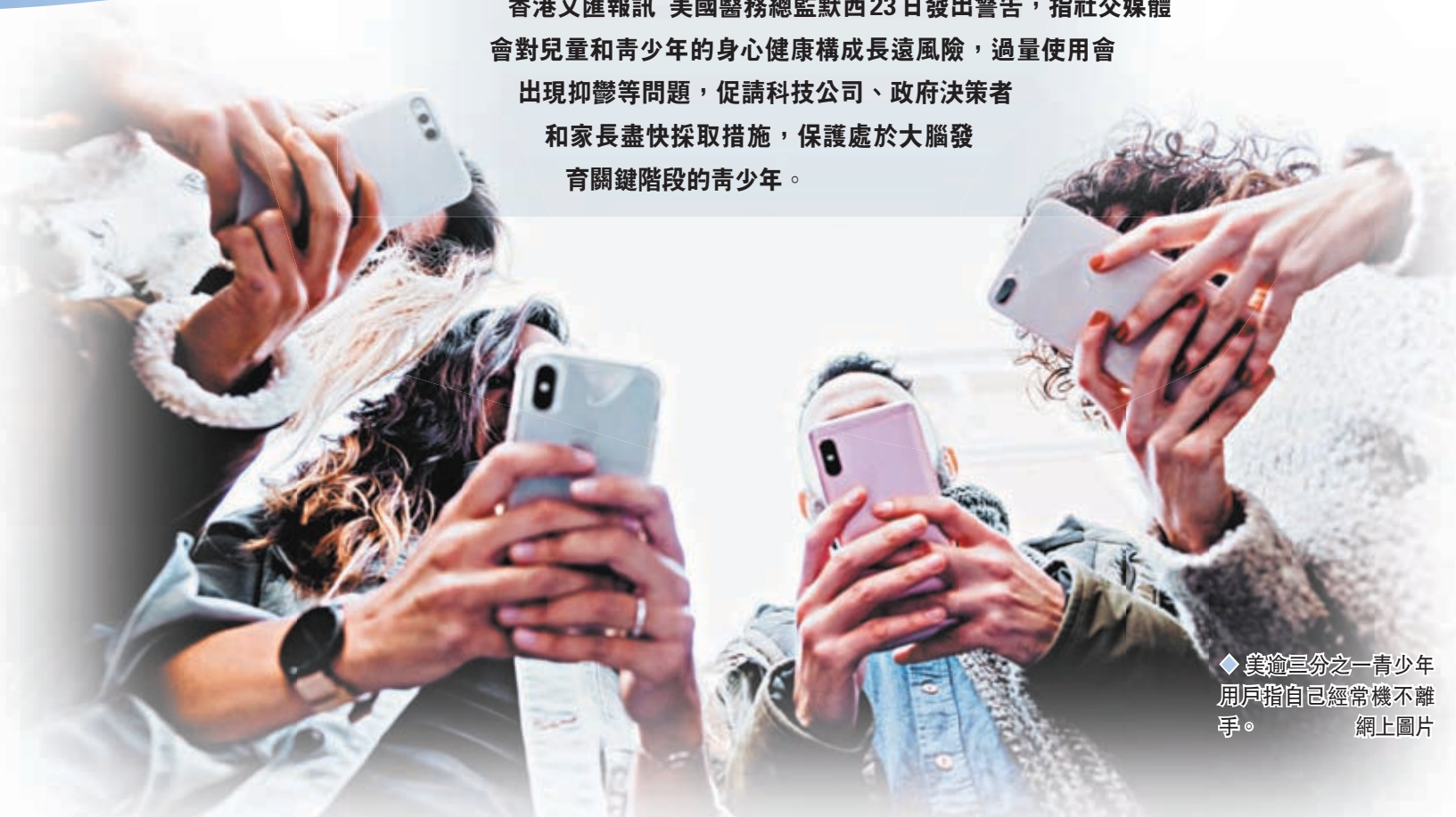
◆美逾三分之一青少年用戶指自己經常機不離手。

香港文匯報訊 美國醫務總監默西23日發出警告，指社交媒體會對兒童和青少年的身心健康構成成長遠風險，過量使用會出現抑鬱等問題，促請科技公司、政府決策者和家長盡快採取措施，保護處於大腦發育關鍵階段的青少年。