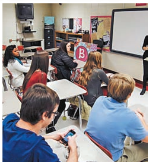
◆美多個校區指控社媒導致兒童心理健康和行為障礙惡化。網上圖片

訴訟引述美國疾病控制及預防中心(CDC)的數據，表示高中生因抑鬱而萌生自殺念頭的比例已攀升。