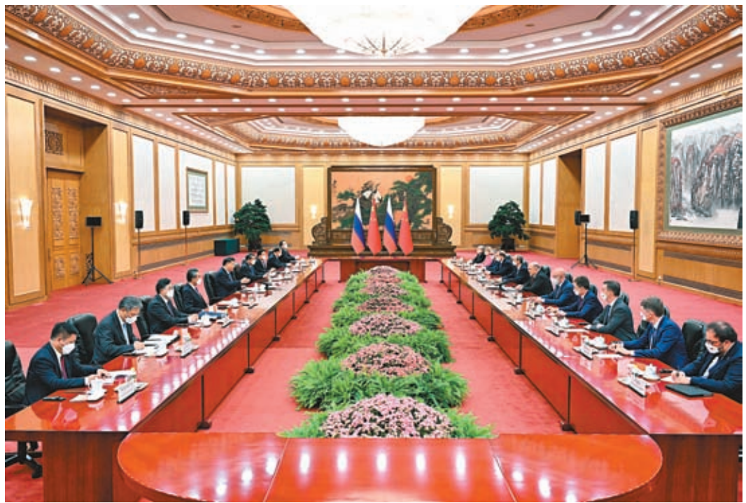
▲5月24日下午，中國國家主席習近平在北京人民大會堂會見來華進行正式訪問的俄羅斯總理米舒斯京。