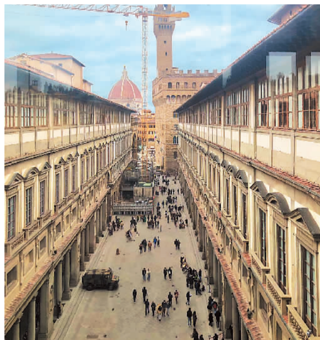
乌菲兹美术馆是世界著名绘画艺术博物馆。