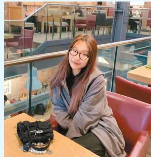
作者在伦敦咖啡馆。

三明治类很有特色。无论早餐、午餐还是晚饭，英国人随手买一个三明治凑合吃的情况很常