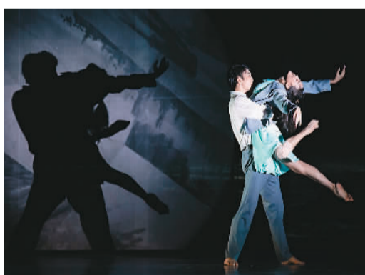
▲舞剧《东方大港》剧照

n-TOS系统是什么？n-TOS系统是宁波舟山港自主研发的集装箱码头生产操作系统。它的研发成功，结束了中国“千万级”集装箱码头依赖国外系统的历史。