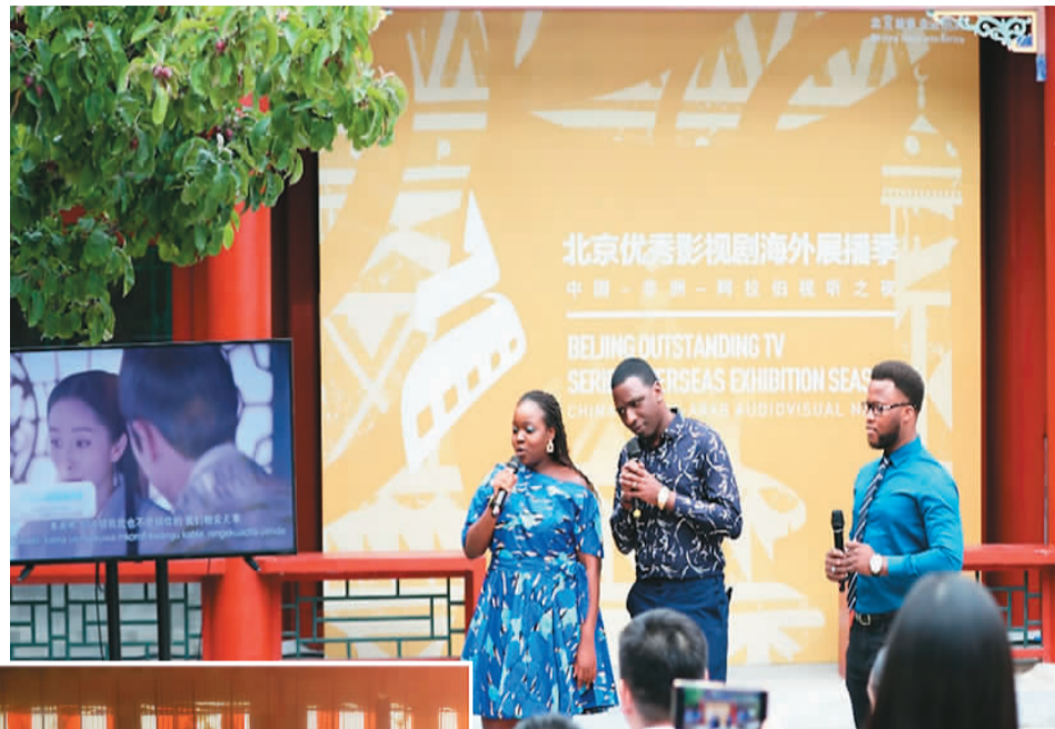
▲北京优秀影视剧海外展播季“中国—非洲—阿拉伯视听之夜”现场配音秀

斯瓦希里语的《西游记》《三十而已》、豪萨语的《欢乐颂》《熊出没》、祖鲁语的《舌尖上的