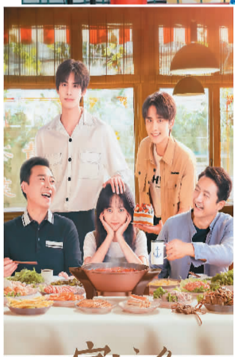
▲电视剧《以家人之名》海报