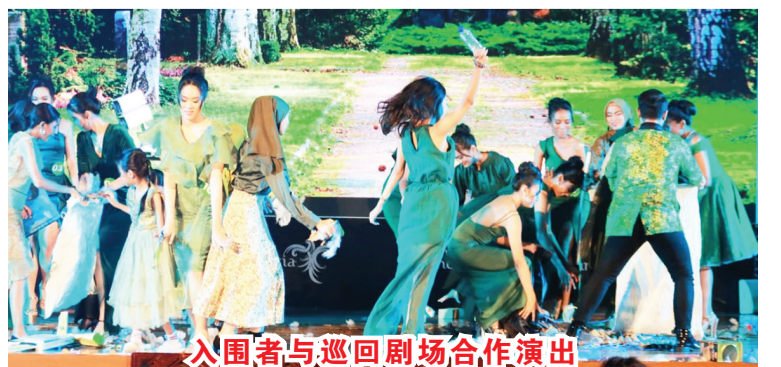
入围者与巡回剧场合作演出