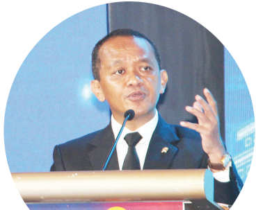
我国投资部长/投资统筹机构主席巴赫里尔

【本报讯】2023年印中智慧城博览会正式举办。该活动于2023年5月24日至26日在雅加达香格里拉酒店举行。除了加快印尼政府建设智慧城的计划,例如新国都努山达拉和其它城市。印尼华裔总会希望,这次活动能成为提高投资并向各地区提供信息。