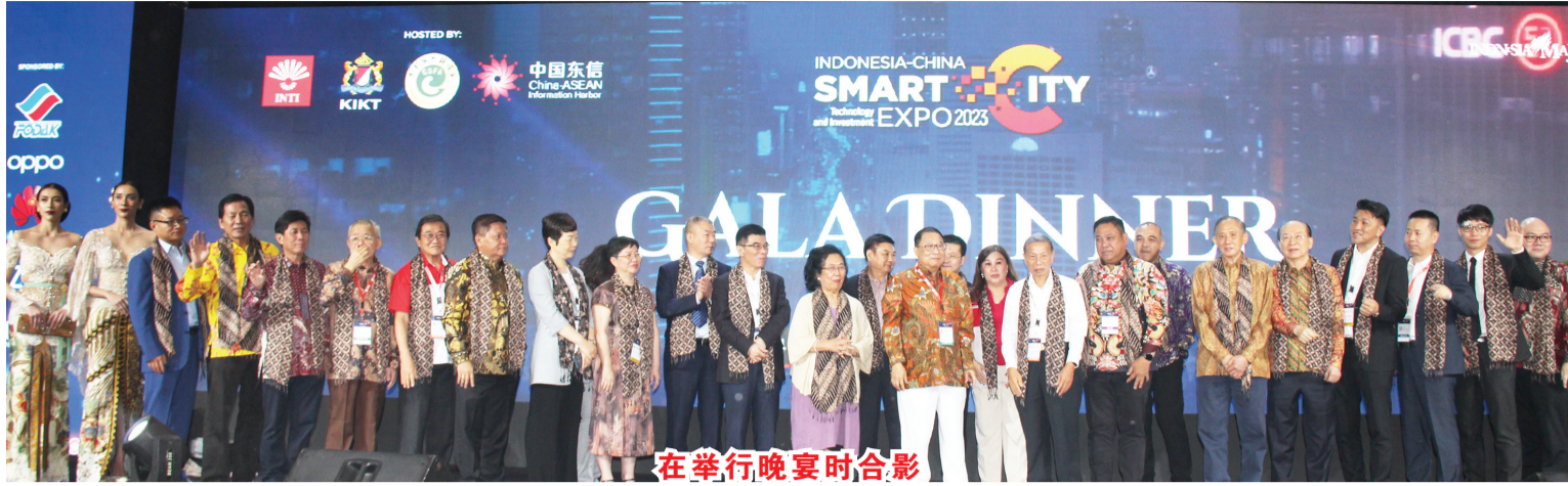
在举行晚宴时合影

巴赫里尔在发表讲话时说:“在政治上,佐科维总统与中国国家主席习近平的关系良好。出于这个原因,希