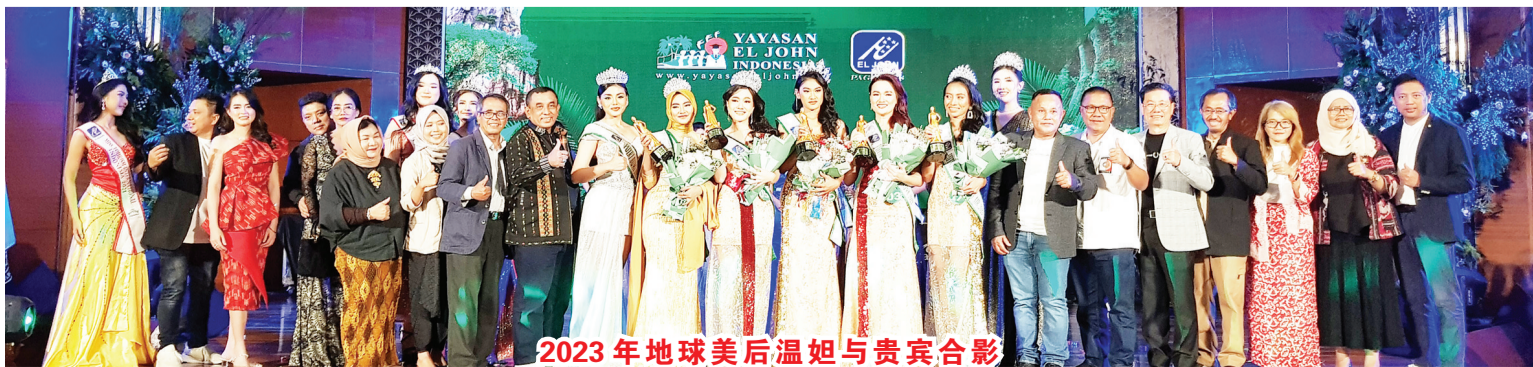
2023年地球美后温姐与贵宾合影