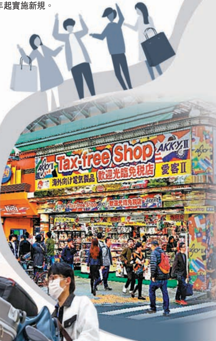
各地遊客喜歡到日本掃貨。網上圖片

香港文匯報訊 不少海外遊客都有在日本免稅「血拚」的經歷，但有部分人士利用日本稅制漏洞，在境內非法轉售商品牟利。共同社22日引述消息人士稱，日本政府已開始探討改革現行的商品退稅制度，先讓遊客以稅後原價購買，確認符合條件後，才允許旅客完成退稅手續。政府將在今年底前匯總稅制改革詳情，最早從明年起實施新規。