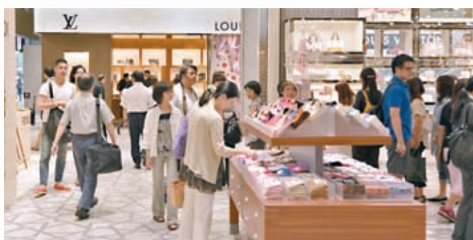
日本售賣奢侈品的店舖擠滿顧客。

報道指，涉事旅客往往以沒有金錢等原因，拒絕繳納稅款，逾九成的稅款均無法追討。當局除了考慮更改退稅流程，針對拖欠稅款的旅客，也考慮記錄涉事旅客欠稅，在其再度入境時追收。