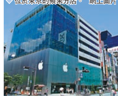
位於東京的蘋果分店。

個主要國家和地區中最低。儘管蘋果公司去年7月緊急為日本銷售的iPhone13加價2萬日圓，但到去年9月新款iPhone14面世，日本的售價在全球37個主要國家和地區中仍是最便宜，自然吸引大量遊客採購。