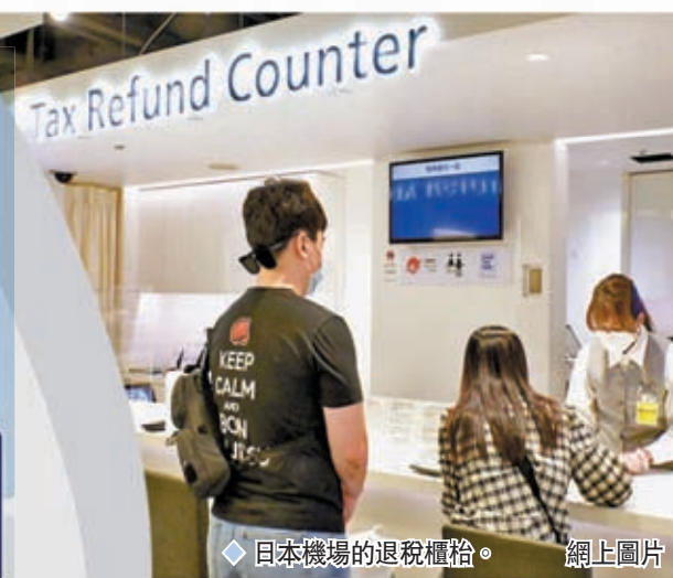
日本機場的退稅櫃檯。

香港文匯報訊 日本追討「走漏」的外國遊客消費稅困難重重，與過時的徵稅制度不無關係。當地稅務專家指出，日本現行免稅制度可追溯到1952年，1989年引入消費稅後，又沿襲「先免稅後繳付」的制度。日本2012年還擴大入境消費政策範圍，將免稅商品涵蓋藥品和化妝品等，加上海關查驗並不嚴格，「走數」問題自然嚴重。