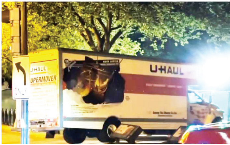
当地时间22日晚，一辆货车撞上了白宫附近拉斐特广场的安全护栏。

中新网5月24日电 综合报道，当地时间23日公布的法庭文件显示，22日晚驾车冲撞白宫外围安全护栏的19岁男子已被捕，并被控多项罪名，包括威胁伤害美国总统和副总统。