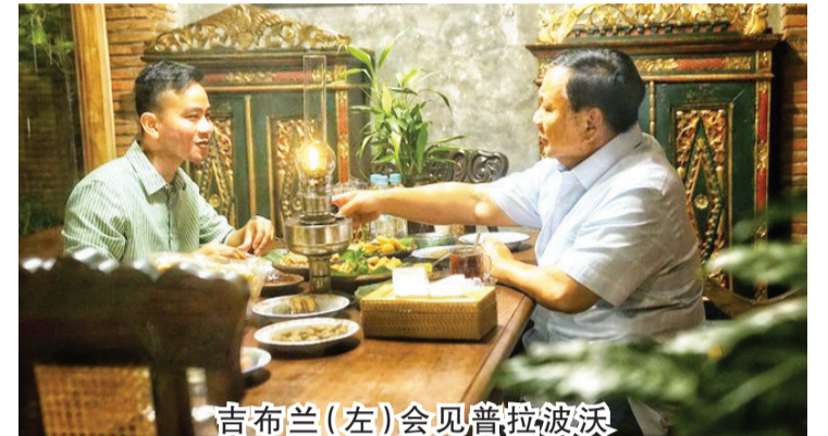
吉布兰(左)会见普拉波沃

是一种吸引力。以便能够中和承运方的各种利益。埃里克也是一个独立人物，与任何政党都无关联。埃里克还能够吸引佐科维总统支持者的认可。 鉴于两者之间的关系非常密切，据估计，佐科维总统将在2024年总统大选中支持埃里克担任副总统候选人。埃里克与佐科维关系非常接近，埃里克很有可能获得佐科维的支持。(亮剑)