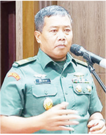
陆军信息服务主任哈明准将(Hamim Thohari)

【本报讯】回应对印尼斗争民主党总主席梅加瓦蒂的批评，陆军表示，在每省组建军区司令部的计划