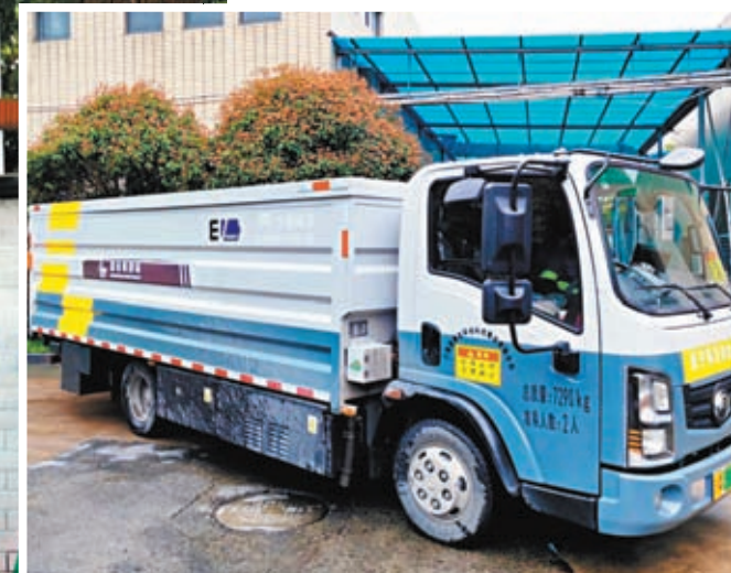
▲上海長寧區新能源濕垃圾車投入使用，實現碳零排放。