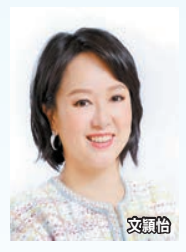
國務院港澳辦、中聯辦、駐港國安公署，以及特區政府的發言人嚴辭駁斥，加上社會各界紛紛發聲，成為香港司法人員依法履職的堅實後盾，保護香港特區司法制度免受任何外部勢力的干擾，所以美國反華政客的威脅注定徒勞無功。

美國反華政客近日又再上演政治鬧劇，通過美國「國會及行政當局中國委員會」（CECC）炮製的所謂「報告」，肆意抹黑《香港國安法》，更點名威脅制裁29名香港國安法指定法官。幸好此等劣行旋即遭到國務院港澳辦、中聯辦、駐港國安公署，以及特區政府的發言人嚴辭駁斥，加上社會各界紛紛發聲，成為香港司法人員依法履職的堅實後盾，保護香港特區司法制度免受任何外部勢力的干擾，所以美國反華政客的威脅注定徒勞無功。