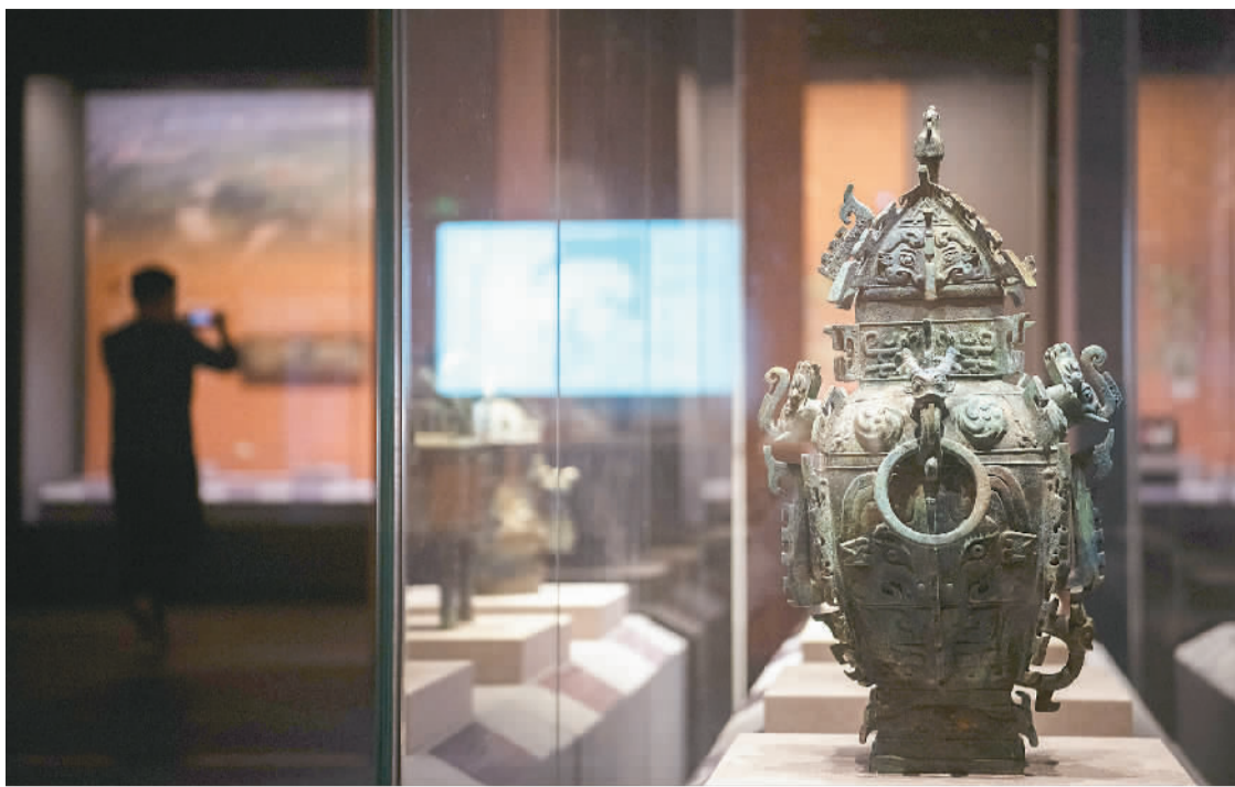
“惟见长江天际流——考古中国·长江中游文明进程研究成果展”现场。