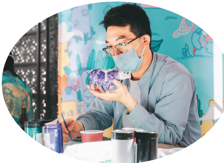
5月18日，国博文创体验活动参与者为陶瓷犀尊涂色。