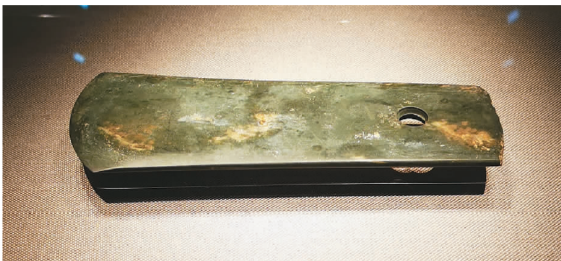
湖北保康穆林头遗址出土的屈家岭文化时期玉钺。

而是部落集会活动用的。”展墙上展示了该建筑复原图，其外观与故宫建筑有不少相似之处。考古研究表明，该建筑的空间布局、营造方法、榫卯结构等特征与后世中国传统建筑一脉相承。