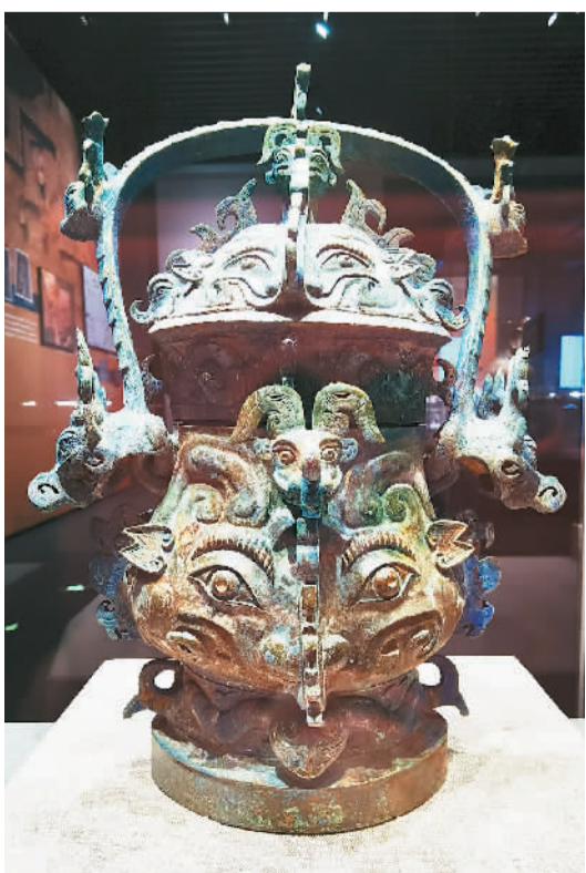
湖北随州安居羊子山墓地出土的西周早期鬲国兽面纹铜卣。