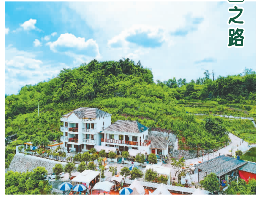
重庆市渝北区古路镇的乡村民宿。

“我现在不用去外头打工，在村子的果园里就能把钱挣到手，收入稳定了，家里也照顾到了。”古路镇乌牛村一位村民开心地说。