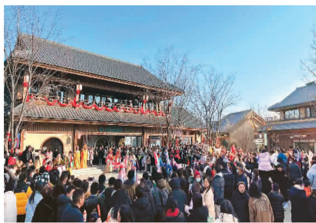
在黄梅戏乡黄梅县，游客在看戏。