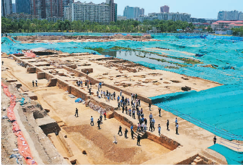
5月13日，“郑州论坛”与会专家学者在郑州商都书院街贵族墓地考古发掘现场进行学术考察。

中国社会科学院学部委员、考古研究所所长陈星灿表示，这些最新考古发现与研究成果，呈现了中华文明起源与发展的不同模式与丰富文化内涵。12处遗址时间节点关键，区域地位突出，展现出中华文明多元一体起源与发展的精彩面貌。