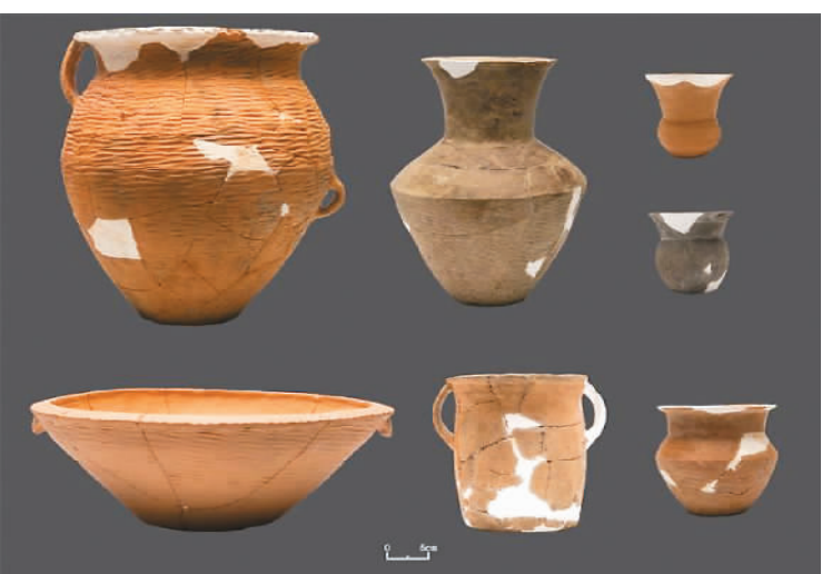
左图：作为迄今关中地区发现的规模最大、保存最完整的客省庄文化聚落，陕西西安太平遗址出土陶器类型丰富。图为该遗址出土的陶器器物组合。

“郑州论坛”搭建了全国重要考古发现和最新研究成果的展示平台、交流平台 and 传播平台，为构建中国考古学学科体系、学术体系、话语体系奠定了基础。