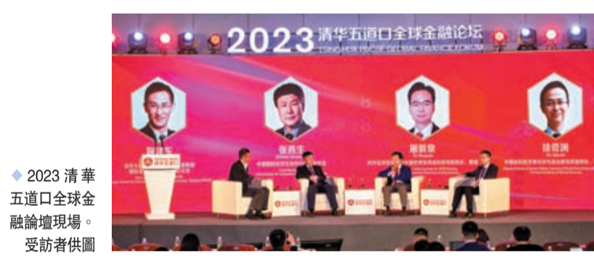
◆2023清華五道口全球金融論壇現場。

香港文匯報訊（記者 海巖 北京報道）國家外匯管理局外匯研究中心主任丁志傑5月20日在2023清華五道口全球金融論壇上發布《2023中國金融政策報告》指出，當前中國經濟運行的外部環境面臨高度不確定性，可以概括為兩個「兩難困境」，一方面，發達國家再次面臨着物價穩定和金融穩定的兩難選擇，美歐加息政策的副作用越來越明顯，有可能引發銀行業危機；另一方面，美歐中心國家和外圍發展中國家不平衡的問題更加突出，新興市場經濟體貨幣金融體系承壓。