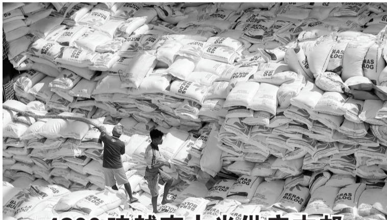
4800吨越南大米供应古邦 5月20日,从越南进口的4800吨大米,已经供应给东努省古邦,这些进口大米是用以社会援助纲领的需要。

她称,印尼在目前世界面临许多挑战中发挥重要作用,印尼有能力与各个国家进行联络和沟通。(Ing)