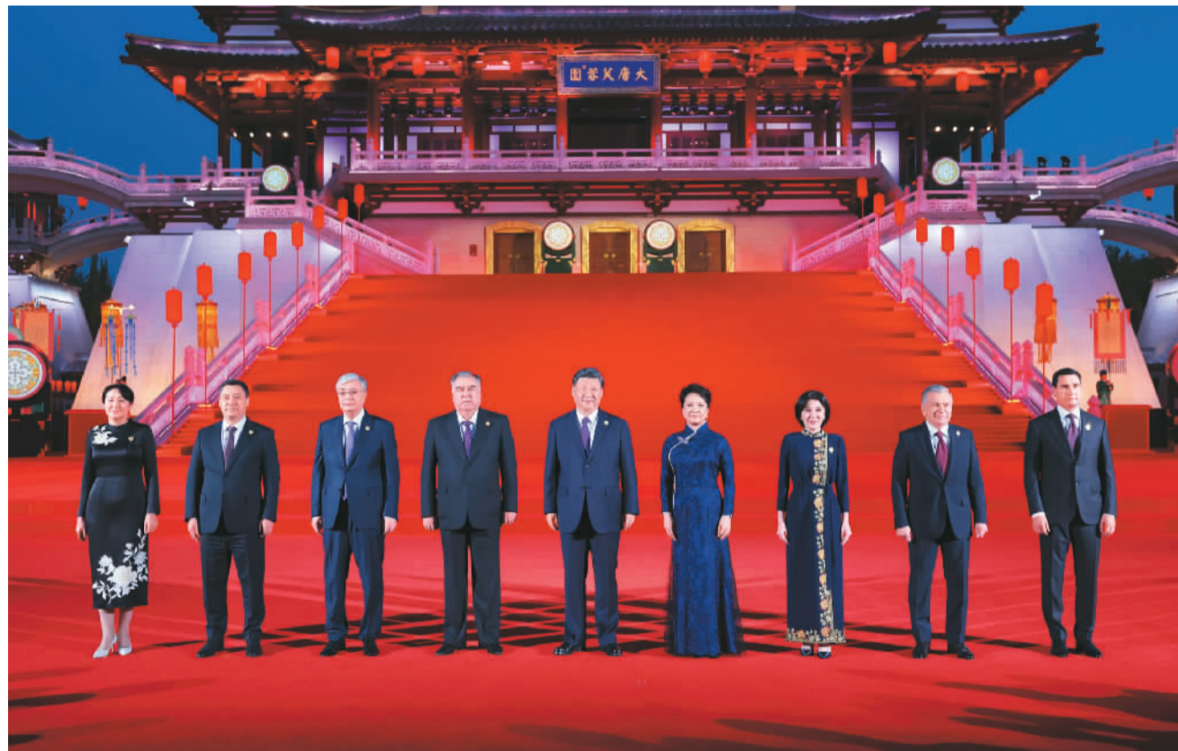
5月18日晚, 国家主席习近平和夫人彭丽媛在陕西省西安市大唐芙蓉园为出席中国—中亚峰会的中亚国家元首夫妇举行欢迎仪式和欢迎宴会。宴会后, 习近平夫妇同贵宾们共同观看中国同中亚国家人民文化艺术年暨中国—中亚青年艺术节开幕式演出。这是习近平夫妇在紫云楼前同贵宾合影留念。