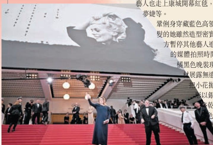
◆法國影后嘉芙蓮丹露是康城影展的常客。