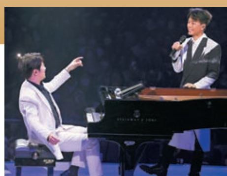
◆郎朗與李克勤為觀眾獻上《深深深》及《我不會唱歌》兩首歌。

福，呢兩首限定版，係2023年5月16日才有。」演唱會做了四晚，克勤每晚除了花、禮物外，仍不斷收到不少利是，他笑道：「每場收到的利是，大家係咪覺得我個樣似屋企負擔比較重？多謝大家鼎力支持李立仁，李力司（克勤兒子）教育基金。」有觀眾現場立即拿出銀紙，叫克勤過去收，克勤見狀即笑道：「你現兜兜擇銀紙出來就唔好，你擇個信封入住佢。」由於觀眾仍不放棄，克勤再安撫對方道：「唔得，唔得，老關開我嘍，仲有兩個鐘（表演完），你搵啲咩入住佢，我一陣再行過來啦。」引得全場大笑。