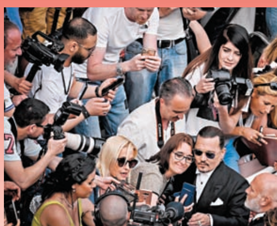
◆尊尼特普與現場粉絲合照。