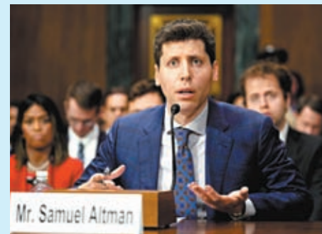
◆ 奧特曼出席參議院聽證會。

歐洲立法機關將全面制訂新 AI 規範，美國立法機關已承諾打擊違反現有公民權利和消費者保護法的有害 AI 產品。