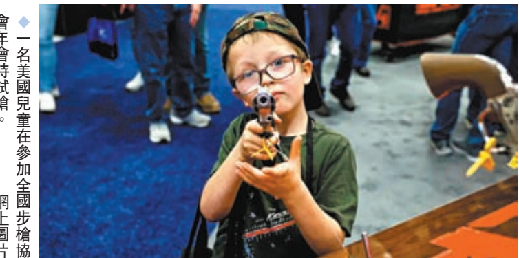
◆ 一名美國兒童在參加全國步槍協會年會時試槍。

報道指出，該社媒研究機構近日在 YouTube 上，建立一個模擬的 9 歲男孩賬號，該模擬賬號在接受 YouTube 相關推薦後，很快被槍支暴力相關的視頻充斥。賬號一個月內累計收到 382 條槍支相關視頻，其中多條視頻