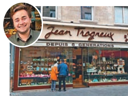
◆ 特羅尼厄及朱古力力商店。

馬克龍決意將國民法定退休年齡由現時 62 歲上調至 64 歲，惹來民眾不滿，並爆發當地近年最大規模示威，其間馬克龍在巴黎一間經常光顧的餐廳遭到縱火。