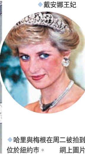
◆戴安娜王妃 ◆哈里與梅根在周二被拍到位於紐約市。